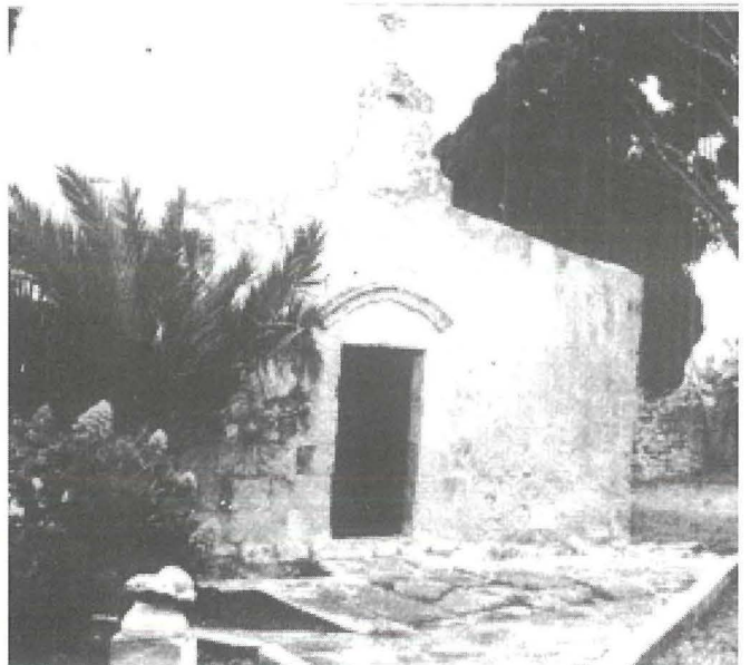
Dehra ġenerali tal-Knisja tal-Lunzjata