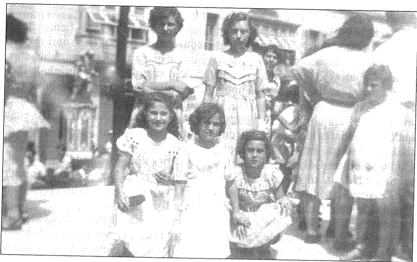
Festa 1948. Il-Hadd filgħodu. Fuq il-planċier quddiem l-Oratorju. Min jaf min huma! Min jaf x'sar minnhom. Tgħid nanniet?

Lukardu ta' l-inbid kien il-hanut tax-xorb ta' l-irġiel fejn illum hemm il-hanut tat-TVs u li qabel ma hadu Consiglio tal-Loewe Opta kien Fergha tal-Barclays Bank. Semmejtu bhala "ta' l-irġiel" għax donnu n-nisa kienu jibzghu jirfsu ġewwa. Niftakarni mmur niġri meta ommi kienet tinhtiegħ xi tapp tasufri għal xi flixxun.....u naturalment tibgħat lili.