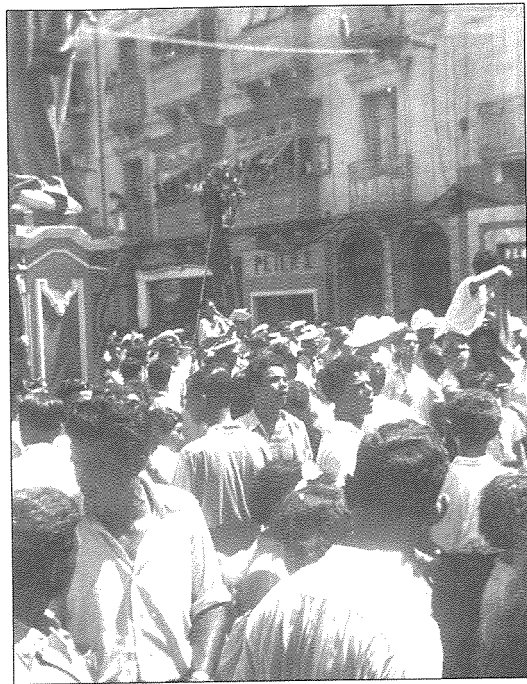
Festa 1948. Fil-març tal-Hadd filghodu. Interessanti tistudja l-andament tan-nies u tara l-hwienet u t-tabelli ta' dak iż-żmien

Dwar il-Lega ktibt artiklu fit-tul meta l-Lega għalqet 60 sena fil-1986. Il-