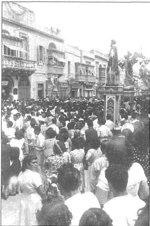
Festa 1948. Quddiem il-Knisja. Il-Hadd filgħodu wieħed josserva kif kien il-bini dak iż-żmien u anki d-djar u l-hwienet.

Il-hanut tax-Xongli quddiemna kien ibieġh bl-ingrossa u bl-imnut mill-ixkejjer. Illum ftit jew xejn baqa’ min ibieġh hekk. Safejn naf jien f’Malta