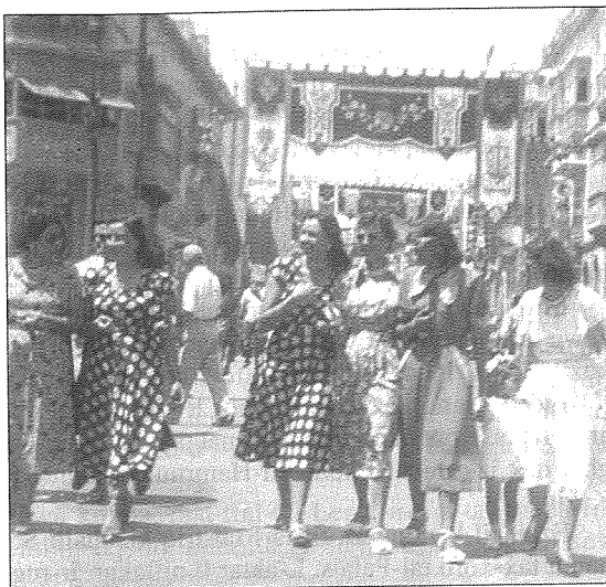
Festa 1948. Il-Hadd filghodu. Quddiem il-Knisja. Osservaw il-moda ta' l-ilbies ta' dak iż-żmien. Il-pavaljuni kienu żżanznu s-sena ta' qabel fiċ-Ċentinarju ta' l-1947.