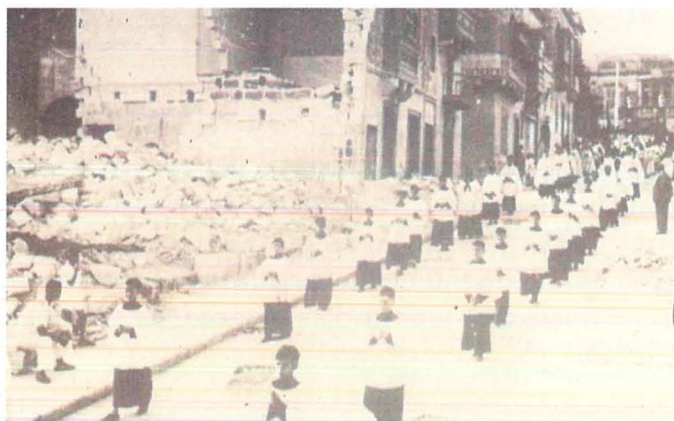
Il-purċissjoni tal-Festa niezla minn Triq San Vincenz qalb it-tifrik li halliet il-gwerra.