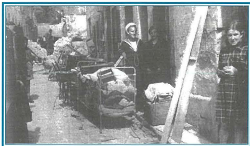
Triq Santa Rita l-għada tat-tragedja tal-11 ta' Marzu, 1941.

F'Jannar 1941 il-qerda tal-Gwerra żdiedet sewwa, peress li bdew l-attakki mill-ajruplani Germaniżi. Fil-11 ta' Marzu, ftit qabel l-għaxra ta' bil-lejl 'tanker' antika li kienet ankrata quddiem il-Knisja tan-Nazzarenu, ġiet attakkata mill-ajru; waqt l-attakk, bomba kbira waqgħet fi Triq Santa Rita, fejn tilfu ħajjithom mhux inqas minn 23 persuna