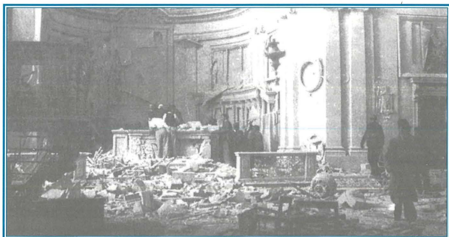
I ta' Marzu 1942 – Il-Knisja milquta mill-bombi ta' l-għadu.

fuq it-tifrik tal-altar maġġur biex johroġ l-Ewkaristija mit-tabernaklu. Kien ġest ta' kuraġġ kbir meta wieħed iqis li minn mument għall-ieħor il-koppla setgħet tiggarraf għal kollox.