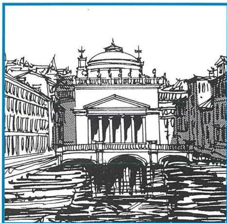
Il-knisja ta' Sant'Antnin fit-tarf tal-Canal Grande (Trieste) tal-arkitett Pietro von Nobile reminixxena tal-Pantheon li setgħet ispirat lill-knisja oriġinali ta' Stella Maris. (Disinn ta' Doreen Yarwood)

Fl-aħħar tas-seklu dsatax u l-bidu tas-seklu għoxrin kien hawn bħal kilba fl-arkitettura ekkleżjastika Maltija sabiex tinbidel, tikber u "tisbieħ" il-faċċata ta' diversi knejjes