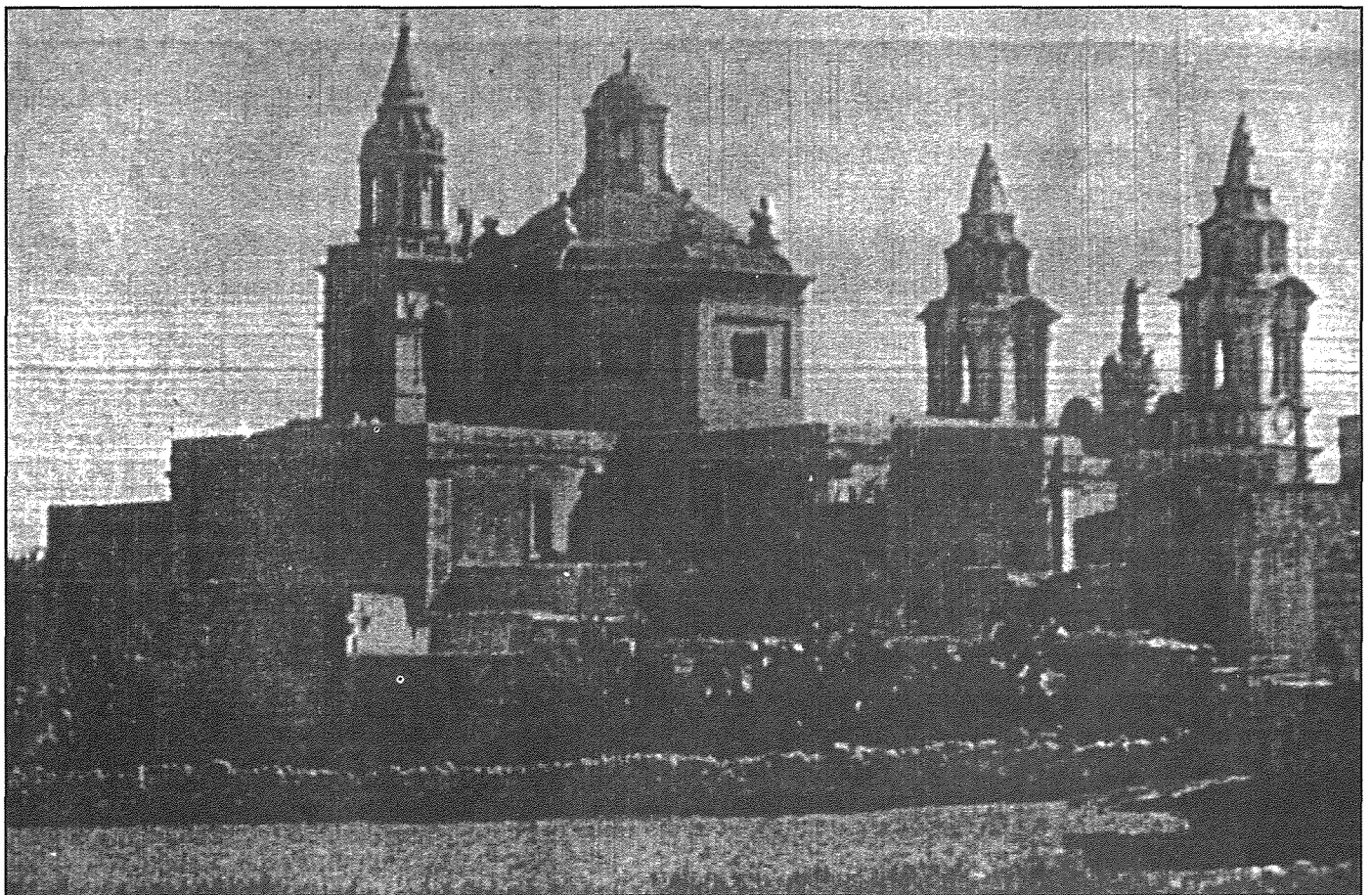
Ritratt tal-knisja parrokkjali tal-Gudja minn wara, qabel ma nbniel l-iskola primarja tal-Gvern u s-sala parrokkjali Marija Bambina.