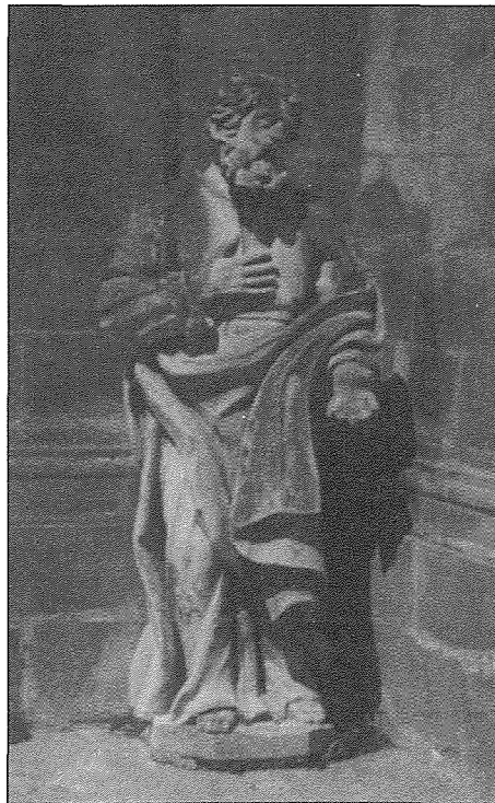
L-istatwi li kienu parti mill-faċċata tal-knisja ta' Hal Farruġ u llum jinsabu fiċ-ċimiterju ta' Hal Luqa fejn inġibdu dawn ir-ritratti.