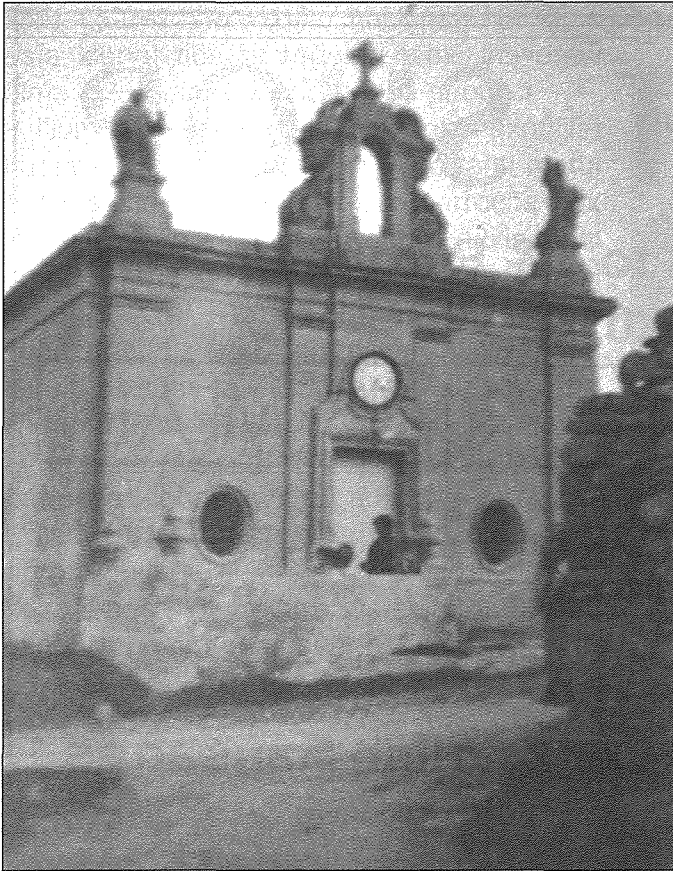
Il-Knisja ta' Hal Farruġ fl-1939 – ritratt Mużew ta' l-Arkejoloġija – Valletta.

spazju hafna iżghar. Ghal dan il-ghan kienet tintuża l-bitħa tal-każin tal-banda La Stella. Dak iż-żmien kien hemm il-kumpanija tat-teatrini 'San Luigi Consaga' miż-Żurrieq li ta' spiss kienet taghmel rappreżentazzjonijiet għall-poplu tal Gudja.