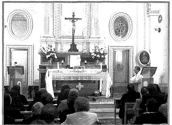
Il-Knisja tas-Sultana tal-Qalb ta' Ġesù

"Nixtiequ nroddu ħajr u nigglorifikaw lil Alla talli għażel lil Marija fost il-ħlejjaq kollha sabiex tiffirma fil-guġ verginali tagħha l-Qalb adorabbli ta' Ġesù... nitolbu lil din l-Omm Vergni mimlija kompassjoni sabiex tmexxina lejn il-Qalb ta' Ġesù".