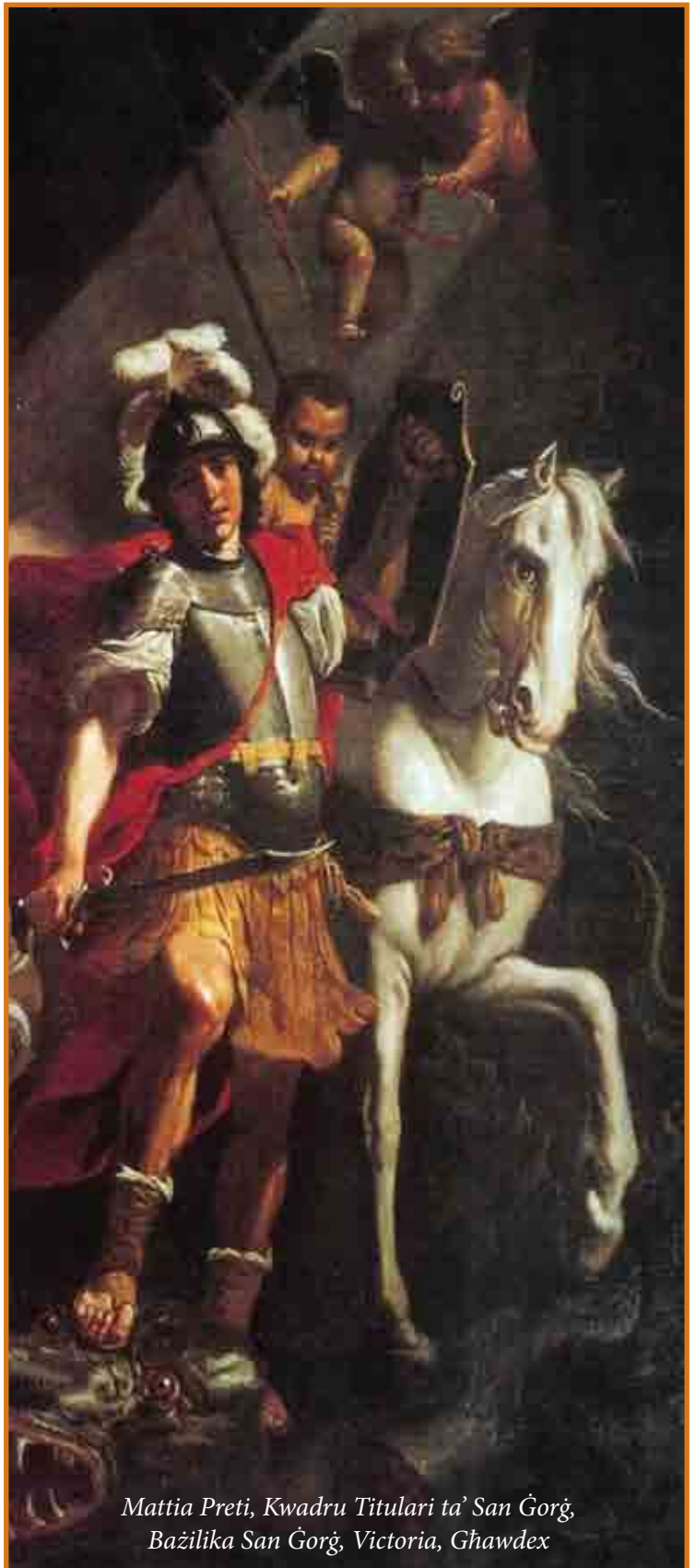
Mattia Preti, Kwadru Titulari ta' San Ġorġ, Bażilika San Ġorġ, Victoria, Għawdex