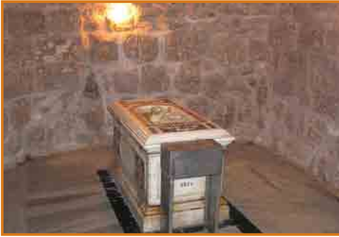
Cenotafju fuq il-qabar ta' San Gorg f'Lod

il-Bizantini, Lod kienet belt importanti u kienet meqjusa bħala santwarju famuż li fih l-insara kienu jqimu wiehed mill-akbar martri tal-Kristjanità, jġifieri San Ġorg. Imma qabel ma nħarsu lejn il-kult mogħti lil San Ġorg, u li għalih Lod baqgħet famuża, tajjeb li nagħtu daqqa t'għajn lejn l-oriġini tal-kristjaneżimu f'dawn l-inhawi. Digà semmejna s-silta ta' l-Atti 9,32-25, li fiha Pietru jfejjaq lill-paralitiku Enea. L-arkeologu Franġiskan P. Bellarmino Bagatti OFM, fil-ktieb "Ancient Christian Villages in Samaria", jagħtina studju interessanti dwar il-kristjaneżimu f'Lod. Hu jistaqsi: min kienu l-ewwel ewangelizzaturi f'Lydda, jekk l-awtur ta' l-Atti jgħid li Pietru mar iżur il-qaddisin (l-insara) f'din il-belt? Skond tradizzjoni tas-seklu 10, li giet ippreservata fil-lingwa Ġorġjana imma li kienet giet tradotta mis-Sirjak, l-ewwel ewangelizzatur kien Ġużeppi minn Arimatija. Fil-fatt, skond it-tradizzjoni Ġużeppi kien mill-belt ta' Ramleh, li illum il-ġurnata tmiss ma' Lod u kienet qrib hafna tagħha. Skond dan id-