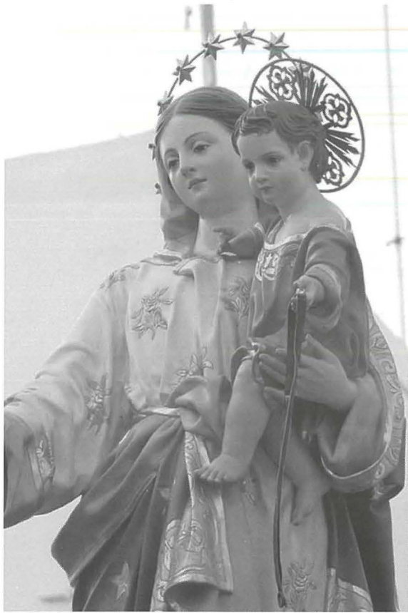
L-istatwa tal-Madonna taċ-Ċintura