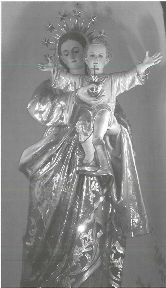
L-istatwa tal-Madonna tas-Sacro Cuor meqjuma ġewwa s-Santwarju tal-Grazzja, f'Haż-Żabbar