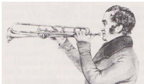
Flatt Trumpet bl-islajd (André Previn's Guide to Music: Mac Millan London 1983)