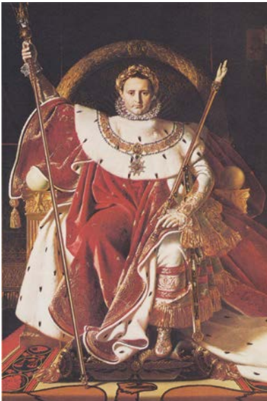
Napuljun Bonaparti jinkuruna lili nnifsu bħala Imperatur ta' Franza fl-1804

U hawn fejn proprju jidhol l-imsemmi marċ funebru ta' Handel, f'forma ta' innu, li jintroduċi l-esekwji – dawk ir-riti u ċerimonji tal-funeral – għall-imwiet ta' Sawl u ibnu Ġonata. Fih insibu parti għall-orgni u trumbuni, li jalternaw mal-flawti, l-obwejet u d-daqq kiebi tat-timpani. Illum il-gurnata, dal-innu jindaqq tista' tgħid f'kull funeral statali, kif ġara f'dak ta' Winston Churchill, George Washington u Abraham Lincoln. Il-banda tal-forzi armati Ġermaniża wkoll għandha dal-marċ fir-repertorju bandistiku tagħha u jindaqq b'mod regolarment f'kull okkażjoni li tinqala'.