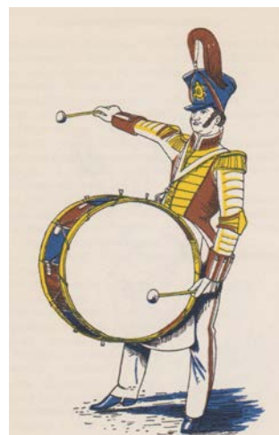
Il-katubier: Illustrazzjoni ta’ Paul Sharp (The Observer’s Book of Music)

Minn daqshekk, dal-marċ hu mibni fuq il-mudell ta’ kwalunkwe marċ funebri ieħor peress li jimxi bil-mod, b’pass meqjus, fi kjavi minuri, u f’temp ordinarju t’erba’ taħbitiet kull battuta, biex b’hekk jiġi jixbah ’il purċissjoni funebra. U għad li ħadd ma jaf eżatt meta twieldu dal-marċi funebri, xi kotba antiki tal-mużika militari jgħidu li l-ewwel tax-xorta tagħhom kienu jikkonsistu biss f’taħbit lajman u sempliċi min-naħa ta’ katuba, jew xi tanbur kbir ieħor. Mhux biss, iżda dawn kienu jkunu