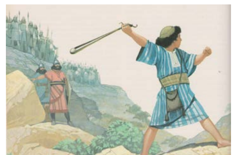
David ixejjer l-iżbandola biex joqtol lil Goljat.

Minn hemm 'il quddiem l-affarijiet bejniethom bdew jehżienu tant, li Sawl kemm-il darba ried joqtol lil David minħabba l-ġhira u l-mibegħda li kellu lejha għal xejn b'xejn. Biex tgħaxxaqha, lil David kien naqsu milli jżewġu lil bintu l-kbira Merob kif kien wiegħed li jagħmel jekk jirbħu lill-Filistej. Minflok, David ħa lil oħtha Mikol. Ironikament, mhux l-ewwel darba wkoll li David intalab minn Samwel biex imur idoqq l-arpa u jgħanni quddiem ħatnu Sawl biex iderrilu kif jista' mid-dwejjaq kbar li ta' spiss kienu jaħkmuh. U biex il-kobba tkompli tithabbell, Ġonata, iben Sawl, kien ammiratur u ħabib kbir ta' David, speċjalment wara l-episodju ta' Goljat. Għedt