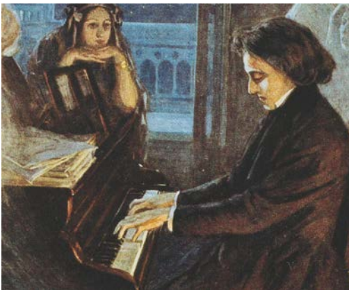
Chopin qed jikkomponi l-marċ funebru fuq il-pjanu

Izda qabelxejn tajjeb ngħidu li Chopin, bhala wiehed mill-kompożituri li ġew fl-eqqel tal-Romantiċizmu, kellu mħabba tal-ġenn lejn art twelidu – il-Polonja. Infatti, f'wahda mit-taħditiet mużikali ppubblikati ta' Pace insibu li: “Kważi x-xogħol kollu tiegħu [ta' Chopin] hu kkulurit bis-sogħba li hass għall-isfortunat pajjiż.” 2 Barra minn hekk, Chopin kien dejjem jindiehes u jifhabbe mal-kittieba u pitturi ta' zmienu, bil-konsegwenza li xogħlijietu huma mimlijin poezija u kwadri misthajla ta' sbuħija liema bhalha. Fost il-ħbieb tal-qalba, saħansitra nsibu liċ-ċelebri pittur Franciż Eugène Delacroix (1798-1863), li fil-funeral ta' Chopin kien wiehed mis-sitta li żammew il-faldrappa waqt il-funeral tiegħu. Chopin indifen fiċ-ċimiterju Père Lachaise ta' Pariġi.