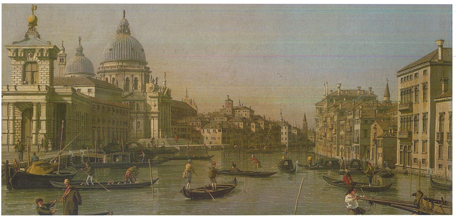
Il-kwadru 'La Punta della Dogana' ta' Francesco Guardi

Hafna referenzi għad-dwana u l-attività tagħha insibuhom ukoll f'ħafna rumanzi ta' spjunaġġ, speċjalment f'dawk tal-maestri ta' dan il-ġeneru bħal Graham Greene (1904-1991), Larry Collins (1929-2005), Len Deighton (t. 1929), John Le Carré (t. 1931), Frederick Forsyth (t. 1938) u Ken Follett (t. 1949).