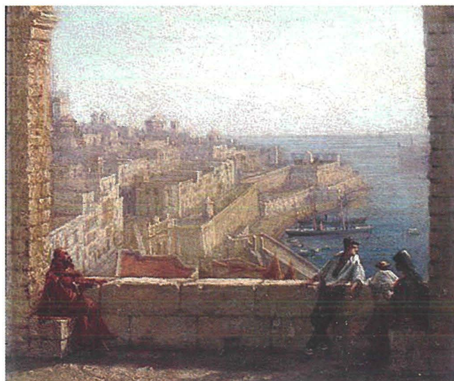
Il-kwadru tal-veduta mill-Barrakka ta' Fuq ta' Girolamo Gianni

Dwanier, jew ahjar ex-dwanier, bhala protagonista principali go rumanz insibuh fil-karattru ta' Cicikov fil-ktieb Le anime morte (1842) ta' Nikolai Vasilievich Gogol (1809-1852). Mill-attività tal-protagonista