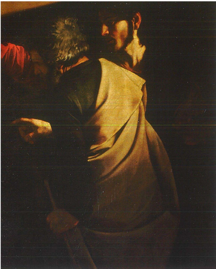
Il-kwadru ta' San Matthew ta' Caravaggio

bhala ufficjal tad-dwana mhux possibli li biex naghmlu deskrizzjoni, madankollu, hija vallapena li ngibu l-kliem li Gogol juza biex jiddeskrivi d-diligenza u l-iskruplozità: “ andava a rovistare nelle ruote, nei timoni, nelle orecchie dei cavalli e non si sa in quanti altri luoghi, dove a nessuno scrittore è mai venuto in mente di ficcare il naso, e dove è lecito ficcare il naso soltanto agli impiegati di dogana; tanto che il disgraziato viaggiatore, pur dopo aver passato la frontiera, ancora per parecchi minuti non riusciva a tornare in sè... ”.