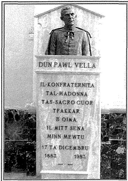
Il-Bust ta' Dun Pawl Vella fil-Parroċċa taqħna