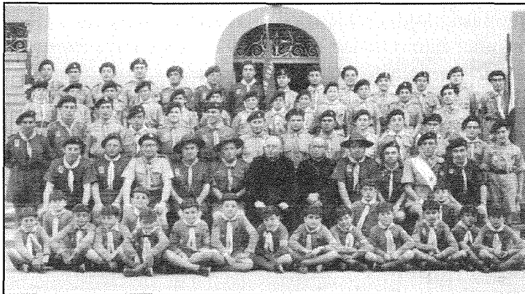
L-iscouts tal-Mosta fl-1952