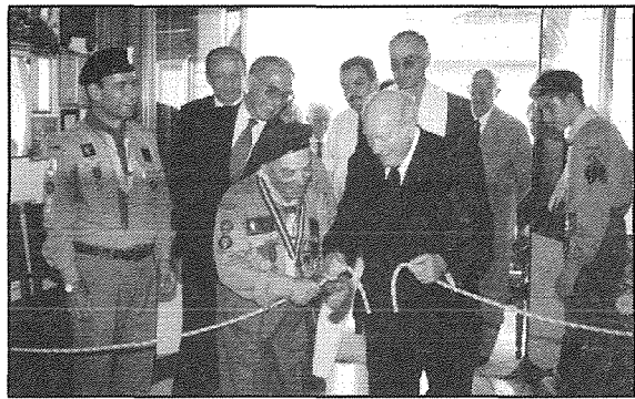
Il-Prof. Guido Demarco jiftah wirja fil-kwartieri fit-23 ta' Ġunju 2002