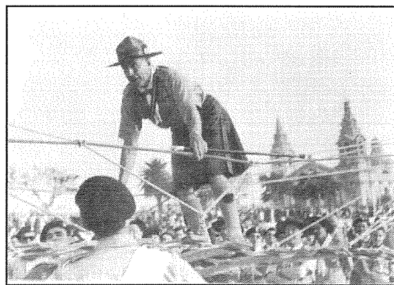
Lord Rowallan fil-Floriana

L-aktar parata kommemorattiva li niftakar kienet dik li kienet inżammet fix-Xagħra tal-Floriana fl-1954 meta Lord Rowallan, Chief Scout tal-Commonwealth u l-Imperu Inġliż żar Malta. F'din il-parata, il-gruppi kollha ta' Malta kienu preżenti.