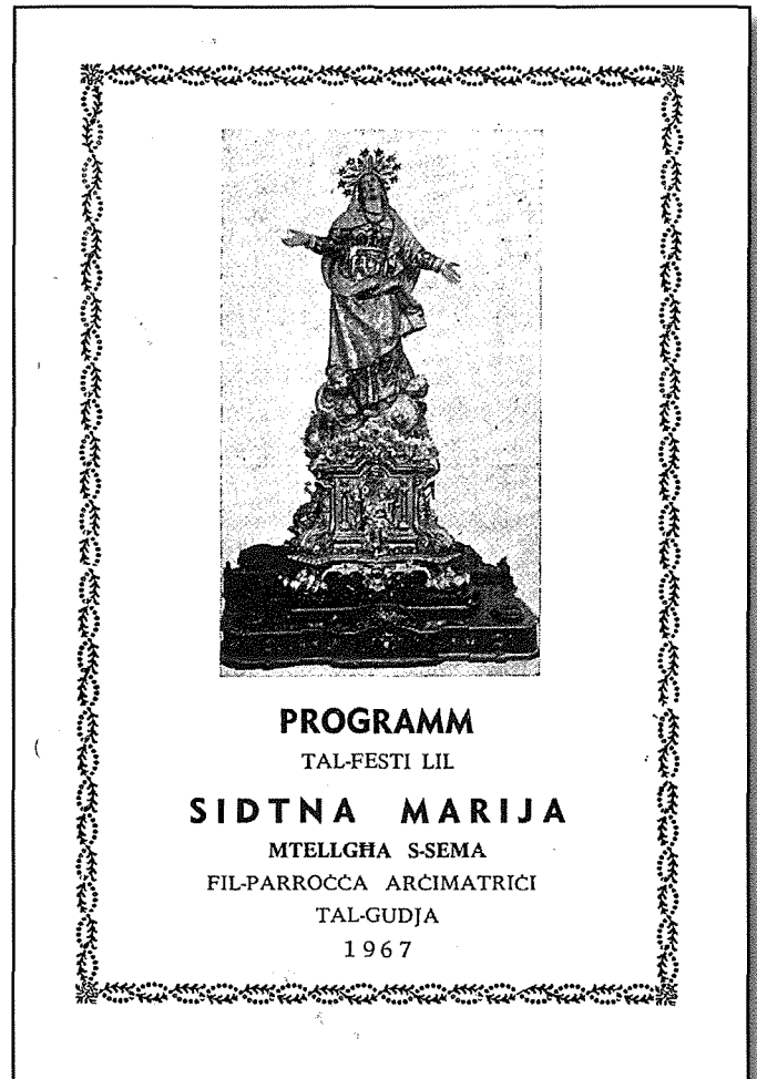
Il-faccata tal-programm tal-festa tal-1967

Il-festi ta' barra kienu jsiru fuq tlett ijiem u kienu jibdeu fl-aħħar jum tat-Tridu. Kienu jsiru marċi u programmi kemm mill-baned tal-lokal kif ukoll minn baned barranin li kienu jkunu mistiedna għall-okkazjoni tal-festa. Fl-1965, iżżanznu tmintax-il bandalora li juru diversi titli li nagħtu lill-Madonna fil-Litanija li illum il-għurnata jintramaw tul Triq Raymond Caruana. Imbagħad, sentejn wara, fl-1967, iżżanznu seba' pavaljuni godda bil-pittura li juru l-misteri mill-hajja tal-Madonna.