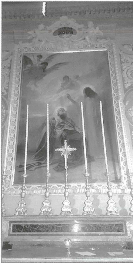
L-Altar ta' San Ġużepp fil-Parroċċa Arcimatriċi tal-Gudja

Fil-fatt din il-petizzjoni giet mibgħuta fit-data tat-12 ta' Jannar 1950.