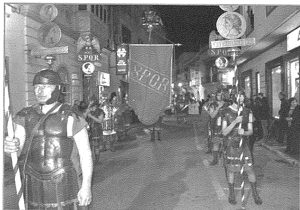
L-Emblemi Rumani, simboli tal-Imperu Ruman

L-Emblemi tar-Rumani: Muniti, Idejn, Ajkli - Dawn huma simboli tal-Imperu Ruman li r-Rumani kienu jgħorru magħhom waqt li jkunu jimmarċjaw.