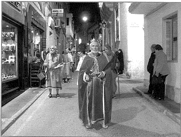
Il-personaġġ ta' David li kien sar għal ewwel darba fl-1971

David - David kien Sultan u Profeta. F'żgħożitu huwa qatel lil ġgant Gulija b'ħames ċaġħqiet. Ibnu Absalon ried joqtlu. David qasam il-Wied ta' Ċedron mingħajr il-kuruna fuq rasu, ħafi u fost kliem ta' żebliħ, tgħajjir u tfigħ tal-ġebel. Izda huwa ħafer dan l-aġir tagħhom. Kien ukoll tradut mill-Kunsillier tiegħu. Il-kostum ta' David sar fl-1971.