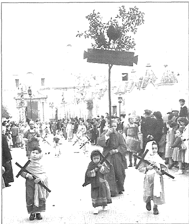
Is-Serduq, Simbolu tač-čahda ta' San Pietru

Suldat liebes ingwanta - Dan is-suldat kien il-Qaddej tal-Qassis il-Kbir, li ta d-daqqa ta' ħarta lil Ġesù għax tkellem u qal is-sewwa.