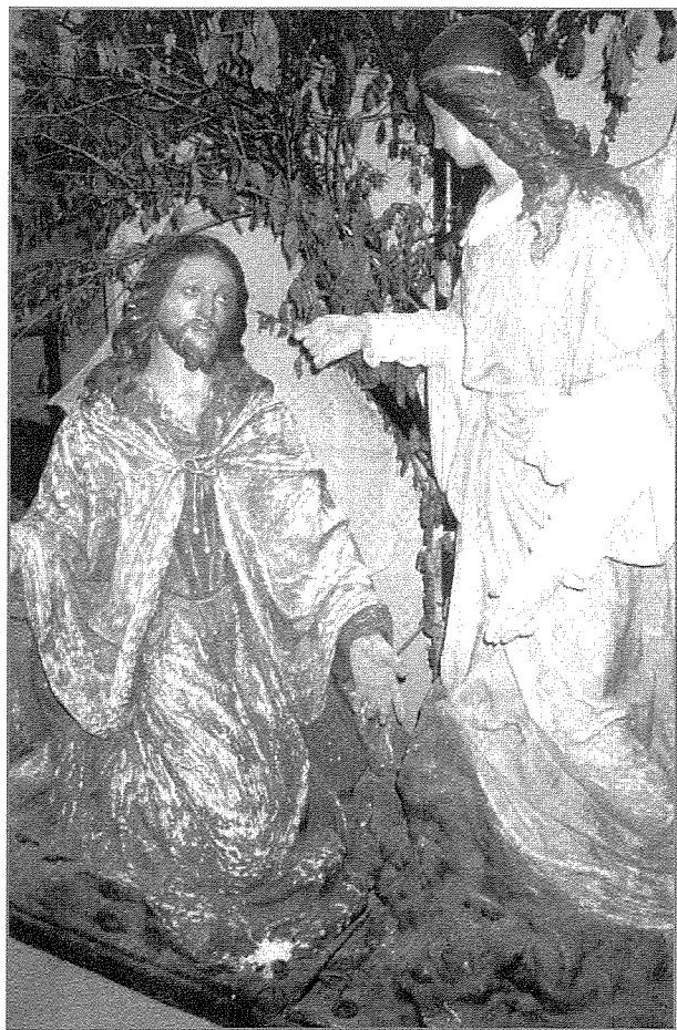
Restawr tal-vara tal-Orto