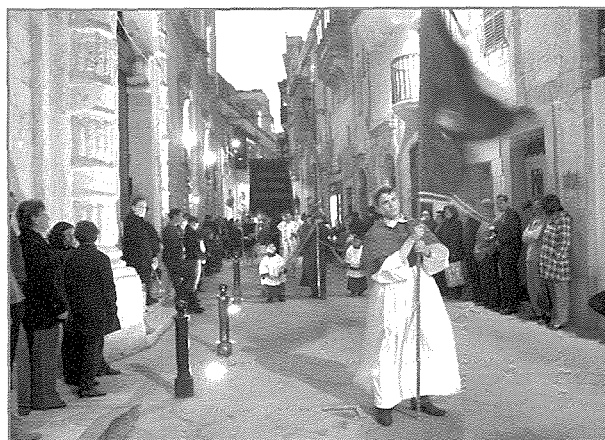
L-Istandart tal-Arċikonfraternità li jimexxi l-purċissjoni

dan jixbah id-damask l-iswed li jgħatti l-ħitan tal-knisja, dawn il-bandalori sal-1970 kienu għadhom miktubin bil-Latin.