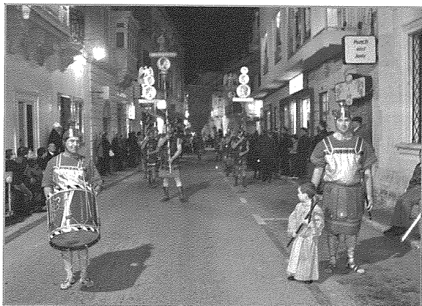
Il-Flawt u t-Tambur personaġġi li jirrapprezentaw il-kundanna tal-mewt ta' Ġesù fuq is-Salib.

Il-Flawt u t-Tambur - Dawn il-personaġġi bid-daqq melankoniku u kiebja tagħhom kienu jnisslu swied il-qalb waqt li l-ikkundannat ikun sejjer għall-mewt. Dan kien speċi ta' Bandu. Kienet din il-purċissjoni tar-Rabat li mill-qedem kif rajna aktar qabel li introduċiet dawn id-daqqaqa f'purċissjoni ta' pellegrinaġġ tal-Ġimgha l-Kbira. Lejn l-aħħar tas-seklu dsatax, il-Prokuratur Depiro Gourgion libbes dawn il-personaġġi b'libsa tas-soldati Rumani. F'1978 saru kosumi godda għal dawn il-bandituri.