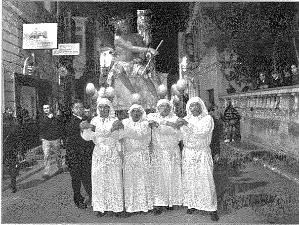
L-istatwa tal-Ecce Homo hija statwa movimentata xogħol l-artist Alfred Camilleri Cauchi.

Baċir biz-Zkuk u l-Ħbula - Simbolu tal-istrumenti li bihom sawtu lil Ġesù.