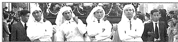
Dettal tar-ritratt fil-purċissjoni tal-1950 fejn ir-reffigħa għalkemm mhux eżatt qedgħin jerrfġu dik li tissejjaħ "refgħa Rabtija".

Ħaġa interessanti fir-ritratt li qiegħed nippubblika tal-purċissjoni tas-sena 1950, u dettall aktar 'l isfel, ir-reffigħa qegħdin jerrfġu l-istatwa tal-Orto bir-refgħa Rabtija. Din kienet magħrufa mir-reffigħa delettanti ta' Malta kollha bħala r-refgħa Rabtija. Din kienet tikkonsisti billi dak tax-xellug jerfa' fuq l-ispalla l-leminija u viċi versa, filwaqt li jorbtu idejhom flimkien fuq sidirhom u jibbilanċjaw il-lasti fuq spallejhom, it-tnejn tan-nofs jaqdbu l-lasti b'idejhom. Hija ħasra li din it-tip ta' refgħa kważi spiċċat għal kollox fil-purċissjoni tar-Rabat u llum ma teżistix regola aktar fl-irfiegħ tal-vari.