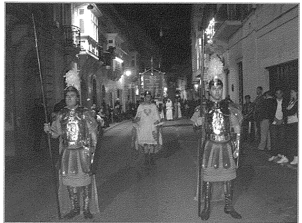
Il-personaġġ ta' Pilatu li fi żmien Kristu kien il-Gvernatur Ruman fil-Palestina

Pilatu - Pilatu, kien aktarx minn Abruzzo fl-Italja ċentrali, kien Gvernatur Ruman tal-Palestina. Għalhekk għaraf li Ġesù kien bla ħtija u minkejja li martu, Klawdja, għarrfitu b'dak il-ħolm li kellha, Pilatu, għax kien bezziegh, naqsitu l-ħila u kkundannah allavolja kien bla ħtija. Dan il-kostum l-ewwel darba li sar kien fl-1957.