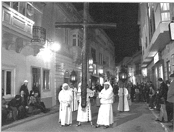
It-Tronku jirrapprezenta z-zokk tas-sigra li fuqha msallab Ġesù Kristu.

It-Tronku - It-Tronku jirrapprezenta z-zokk ta' sigra li minnhakien u jsiru s-slaieb għall-kruċifissjoni. Mela dan is-salib kbir u goff jirrapprezenta s-Salib li Ġesù garr fi triqta lejn il-Golgota, u huwa simbolu tad-dnubiet kollha tagħna li Ġesù kien tgħabba bihom. Kien il-prokuratur Depiro Gourgion, li kien tal-idea li jsir it-Tronku għall-purċissjoni. Dan jikkonsisti f'salib kbir magħmul mill-injam irqiq u kartapesta u jintrefa minn bniedem wiehed bi tnejn oħra jakkumpanjawh. Dan is-salib għadu jinħareġ sal-lum f'din il-purċissjoni mill-aħħar tas-seklu dsatax. Ma' dan it-tronku jkollu jakkumpanjawh