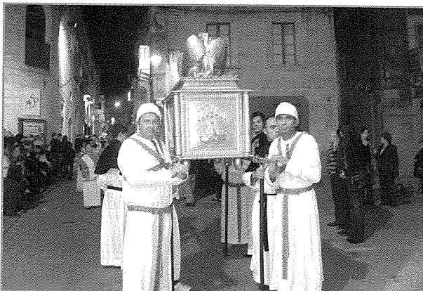
L-Arka, simbolu tal-Ewkaristija Mqaddsa u l-Knisja

L-Arka - Simbolu tal-Ewkaristija Mqaddsa u l-Knisja. Fiha kienu jinżammu t-Twavel tal-Liġi, Ġarra bil-Manna, Għasluġ ta' Aron. Il-ħames Firien