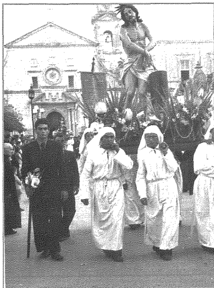
Din l-istatwa, tqila ħafna. Illum ġew miżjuda żewġ reffiegħa ohra.

Fis-sena 2007 kont ġejt avviciinat biex nirrestawra din l-istatwa wara li żviluppawha għadd kbir ta' xquq. Jidher li l-ambjent fejn kienet qiegħda tintrefa u l-qedem ta' din l-istatwa kienu qegħdin iħallu effett ħazin fuq din il-figura ta' Kristu. Din l-iskultura, fl-arti teknikament tisseejjah polikromu jew polikromiku. Jiġifieri maħduma fl-injam miżbugħ. Fl-ixkatlar ta' din l-istatwa ġie skopert għadd ta' affarijiet li ma konniex nafuhom. Għalkemm skolpita minn zokk massiv u goff minn sigra taż-żebbuġ, ċertu partijiet l-iskultur ma setax joħroġhom fuq iz-zokk l-orġinali, għalhekk kellu jżid aktar biċċiet tal-injam biex l-iskultur joħroġ il-figura li kellu f'moħħu. Dawn kienu l-qurrija ta' rasu, l-id il-leminjia kollha, parti mill-minkeb tal-id ix-xellugija, parti mid-drapp ta' qaddu fuq in-naħa tax-xellug u l-pala tas-sieq il-leminjia. Dawn barra li kienu mqabbdin b'minċott u nkollati kien hemm ukoll insiemer li llum tmermru għal kollox.