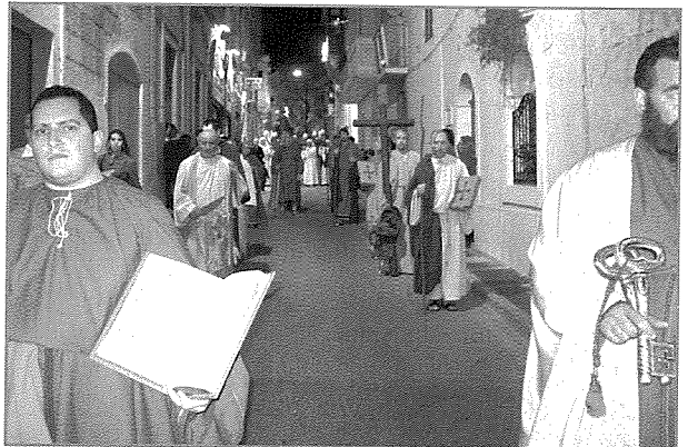
F'dan ir-ritratt jidhru l-personaggi tal-Appostli li saru fl-1974

L-Appostli - Dawn kienu tnax il-raġel magħżula minn Ġesù u li wieħed minnhom ittradieh. Pietru (Xmun) u hüh Indri, Ġwanni u hüh Ġakbu (il-Kbir u bin Żebedew), Filippu (Qalb ta' tarbija), Bartilmew (Nataniel), Tumas (it-Tewmi), Mattew (Levi), Ġakbu (iż-żgħir bin Alfew), Ġuda (Taddew), Xmun (il-Kanani / Zelota), Mattija li kien ġie magħżul bix-xorti flok l-Iskarjota. Dawn il-personaggi kollha saru għal ewwel darba fl-1974.