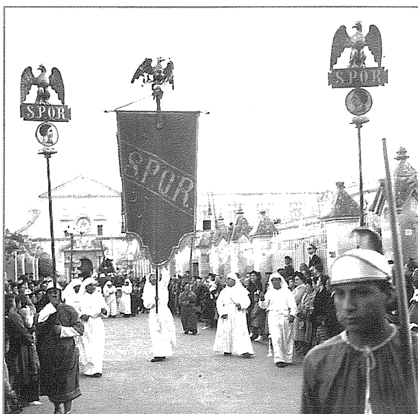
Il-Bandalora li fuqha gġib l-Ajla bl-ittri S.P.Q.R. fl-1950 kienet tintrefgħa mill-Fratelli lebsin il-konfratija

F'dan ir-ritratt li qeġdin niproduċu tal-purċissjoni tal-1950, ir-reffiegħa tal-bandalora, kienu jkunu fratelli, lebsin il-konfratija. Illum ir-reffiegħa għandhom kostum tas-soldati Rumani. F'dawn ir-ritratti storiċi naraw li l-kostumi tas-soldati rumani