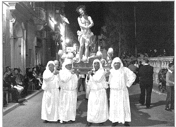
Il-vara tal-Marbut hi l-eqdem statwa li tinħareġ fil-purċissjonijiet lokali tal-Gimgha Mqaddsa.

Fis-sena 2007 kont ġejt avviciinat biex nirrestawra din l-istatwa wara li żviluppawha għadd kbir ta' xquq. Jidher li l-ambjent fejn kienet qiegħda tintrefa u l-qedem ta' din l-istatwa kienu qegħdin iħallu effett ħazin fuq din il-figura ta' Kristu. Din l-iskultura, fl-arti teknikament tisseejjah polikromu jew polikromiku. Jiġifieri maħduma fl-injam miżbugħ. Fl-ixkatlar ta' din l-istatwa ġie skopert għadd ta' affarijiet li ma konniex nafuhom. Għalkemm skolpita minn zokk massiv u goff minn sigra taż-żebbuġ, ċertu partijiet l-iskultur ma setax joħroġhom fuq iz-zokk l-orġinali, għalhekk kellu jżid aktar biċċiet tal-injam biex l-iskultur joħroġ il-figura li kellu f'moħħu. Dawn kienu l-qurrija ta' rasu, l-id il-leminjia kollha, parti mill-minkeb tal-id ix-xellugija, parti mid-drapp ta' qaddu fuq in-naħa tax-xellug u l-pala tas-sieq il-leminjia. Dawn barra li kienu mqabbdin b'minċott u nkollati kien hemm ukoll insiemer li llum tmermru għal kollox.