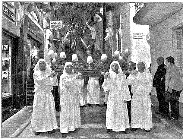
Il-Vara ta' Kristu fl-Ort tal-Ġetsemani fil-purċissjoni tal-2013.