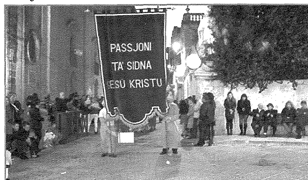
Il-bandalora l-Kbira li ħadet post oħra antika bi drapp iswed.

Wara dawn tibda sfilata ta' personaġġi bibliċi ta' simbolizmi u ta' vari b'figuri li għandhom x'jaqsmu mal-ġrajja tal-passjoni u l-mewt ta' Sidna Ġesù Kristu, għalhekk kollha kemm huma jfakkruna fl-istorja tal-Fidwa sa mill-bidu nett. 157