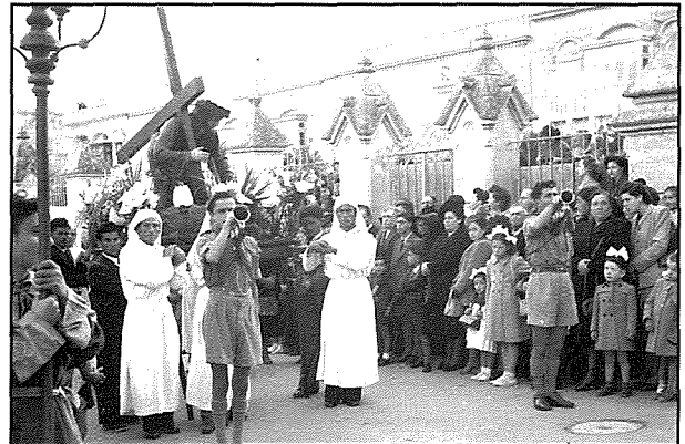
Ir-Redentur fil-purċissjoni tal-1950, fuq quddiem jidhru l-Iscoots idoqqu l-Last Post