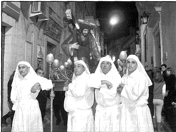
L-istatwa tar-Redentur waqt il-purċissjoni tal-Ġimgħa l-Kbira, għandha devozzjoni kbira fir-Rabat

Il-Ħames Vara - Ġesù Redentur - Min irid isalva, jiċhad lilu nnifsu, jerfa' salibu u jimxi warajja. Mt 16,24.