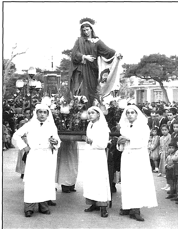
Il-Veronika fil-purċissjoni ta' 1950

jgawdiha sal-gurnata tal-lum tant li baqa' magħruf bħala "Il-Prinċep tal-Istatwarji". Sussegwentement, għall-ħabta tal-1885, mar joqghod il-Ħamrun fejn waqqaf l-istudju tiegħu. Magħruf l-aktar bl-isem ta' Karlozz, Darmanin baqa' msemmi mhux biss għax iproduċa numru enormi ta' statwi u vari iżda wkoll għall-innovazzjonijiet li introduċa fl-ikonografija tal-vari tal-Ġimgha l-Kbira. Darmanin iproduċa numru kbir ta' anġli u statwi biex bihom jiddekoraw it-toroq fil-festi ta' diversi lokalitajiet. Numru konsiderevoli tal-vari proċessjonali li sawwar għall-Ġimgha Mqaddsa huma ta' livell artistiku tassew għoli. Darmanin miet il-Ħamrun fis-26 ta' Novembru 1909 u ndifen fiċ-Ċimiterju ta' Marija Addolorata ta' Raħal Ġdid 170 .