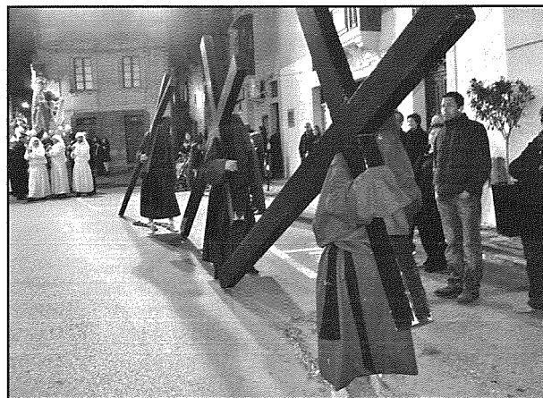
Dawn it-tliet slaleb tal-wegħda jirrapprezentaw it-tliet waqgħat ta' Ġesù fi triqtu lejn il-Kalvarju

Dan rajnieh aktar qabel mill-pittura tal-1590 ta' Matteo Purbus, ikkonservata fl-Oratorju tal-Arcikonfraternità.