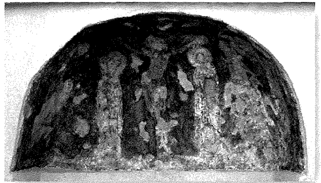
L-affresk stil Gotiku li kien jinsab fil-knisja tal-Abbatija tad-Dejr, illum jinsab fil-Mużew tal-Arti il-Belt.

F'kull katakombi li nsibu fir-Rabat jinstabu simboli Kristjani u slaleb minquxin fil-blat. Semmejna l-Abbatija tad-Dejr f'Bir ir-Riebu fejn Irħieb Bizantini (500-870 W.K.) kienu jiċċelebraw il-kult tal-liturgija tal-Ġimġha Mqaddsa, kif ukoll fl-għerien u katakombi tal-Virtu. Fil-knisja troglodita tal-Abbatija tad-Dejr kien jinsab affresk tas-seklu 14 ġo arzella, li jikkonsisti fin-nofs Kurċifiss u ħdejh il-Madonna u San Ġwann, l-Arkanglu Gabrijel u aktarx San Benedittu. Dan għaliex il-kundizzjoni tal-affresk mhux tajba ħafna u lejn l-aħħar tas-seklu għoxrin ġie mqabbd l-artist Lazzaro Pisani biex jagħmel kopja tagħha bl-akwarella. 5