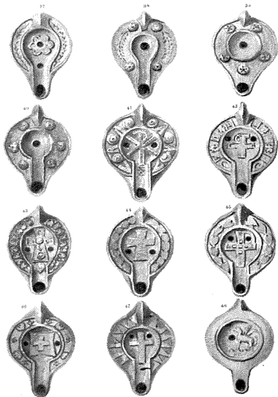
Imsiebaħ b'simboli Kristjani mill-Katakombi ta' Sant'Agata ta' seklu 4 u 5. Tas-seklu 4 u 5 wara Kristu.