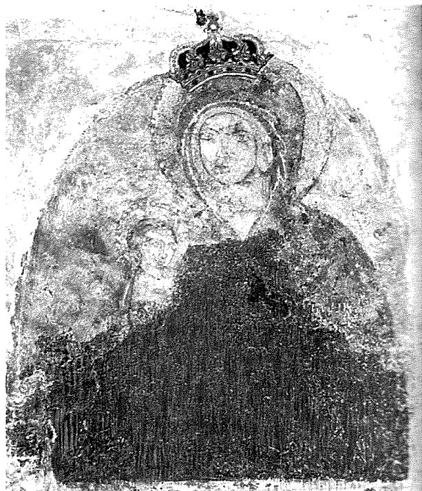
L-affresk Biħantin jinsab fil-kappella troglodita fil-Mellieħa.

L-Ġħarab lill-Kristjani jew lill-Griegi Ortodossi, l-Insara ta' l-ivant, kienu jsibuhom bħala r-Rum. F'Malta nsibu post, Wied ir-Rum li qieġħed bejn ir-Rabat u Ġħad-Dingli fejn jibqā' sejjer sa qrib Miġra l-Ferħa. Dan il-post diħabitat ġħal dak iż-żmien u fertili kien hemm komunitā Kristjana fejn kienu jeħerħitaw il-fidi nisranija tagħhom. Infatti fil-vicinanza ta' dan il-wied hemm ismijiet ta' postijiet bħal: Dar il-binjiet, tad-dejr, eħħ . Fil-vista pastorali tieġħu Mons. Pietro Dusina fl-1575 f'dan il-post, isemmi kif kien hemm ġħadd ta' kappelli li ġħafna minnhom ġħadhom jiffunzzjonaw u oħrajn