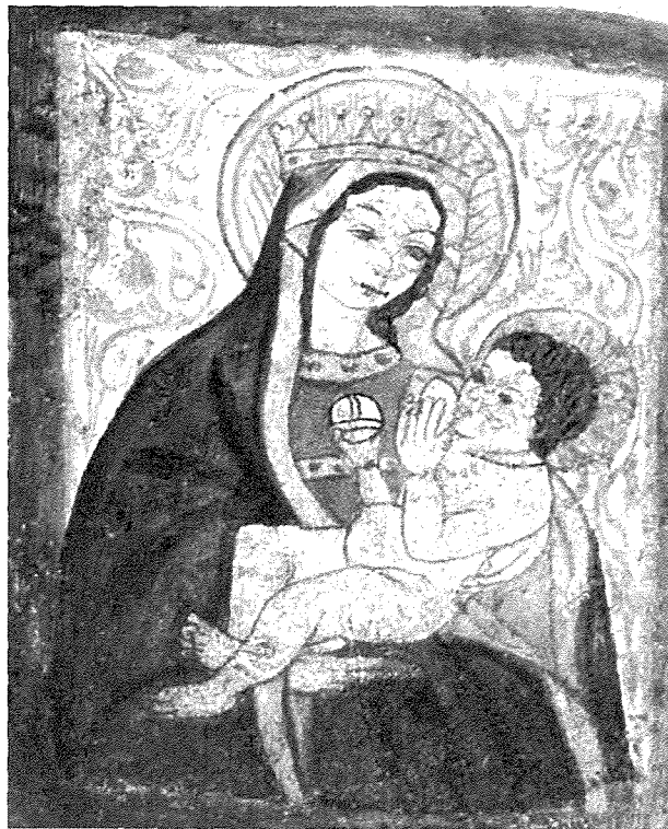
Affreski fil-Katakombi ta' Sant'Agata 1480

Ta' interess ftit 'il bogħod mill-katakombi ta' Sant'Agata kien jinsab iehor illum mitluf, imsejjaħ ta' Santa Venera. Ġiann Frangisk Abela, kiteb hekk fuqu: "Fih għadu jidher affresk xbieha tal-