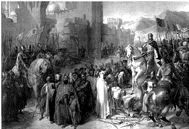
Id-dhul tal-Kruċjati f'Ġerusalem

Wara li joħorġu mill-bini li hemm fil-quċċata tal-Għolja taż-Żebbuġ, li jfakkar it-Tluġħ fis-Sema ta' Ġesù, kienu jinzlu fil-Ġetsemani fejn permezz tal-qari tal-vanġelu, il-kant u t-talb, ifakkru l-arrest ta' Ġesù. Minn hemm kienu jaqsmu Ġerusalem kollha sal-Bazilika tal-Qabar ta' Kristu fejn kienu jsiru ċ-ċelebrazzjonijiet prinċipali.