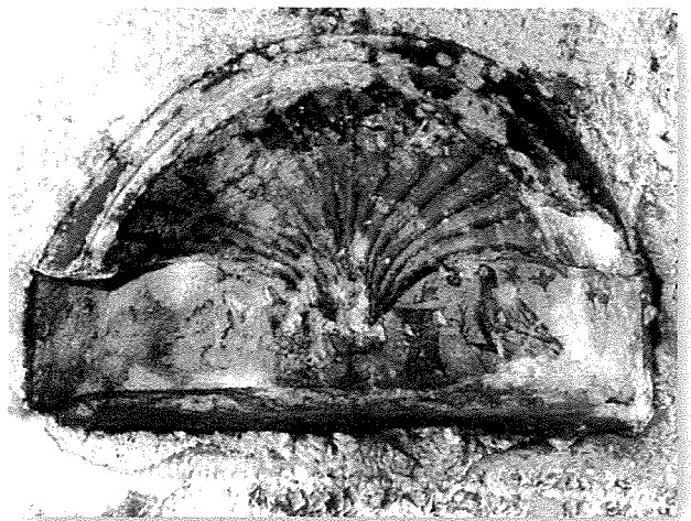
Affreski fil-Katakombi ta' Sant'Agata tas-seklu 4 u 5

Dan hu l-egdem affresk, simbolu tal-passjoni ta' Sidna Ġesù Kristu. Dan ix-xogħol sar fi żmien meta fil-medjuevu dan il-lok kien f'idejn il-patrijiet Benedittini. Wieħed mill-isbah katakombi Kristjan fil-gżejjer Maltin huwa dak ta' Sant'Agata fejn insibu affreski mill-isbah ta' qaddisin, simboli Kristjani taż-żmien bikri, slaleb imnaqqxin fil-blat kif ukoll fuħħar b'disinji Kristjani.