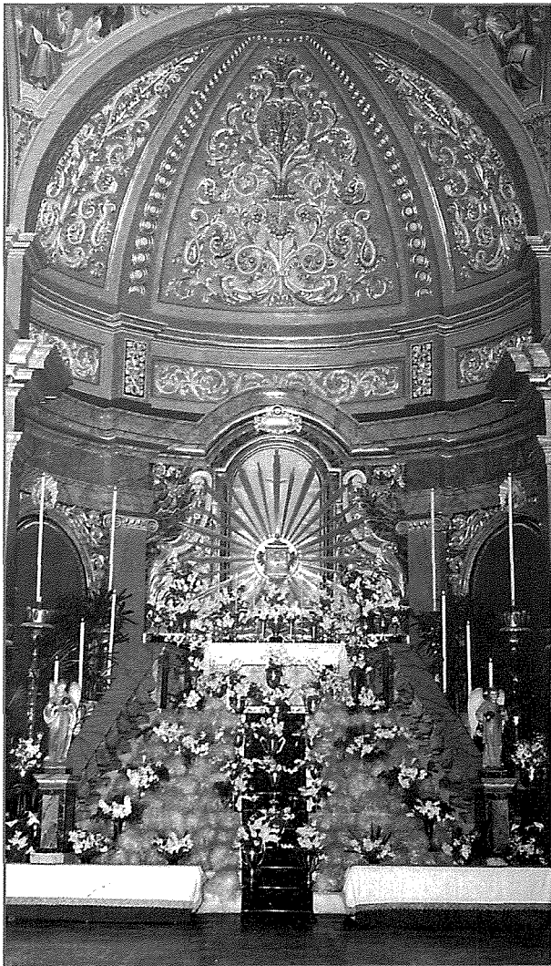
L-Artal tar-Repożizzjoni, f'Ħamis ix-Xirka kif kien jiġi armat żmien ilu.

visti. L-Arcikonfraternità u l-Prokura tal- Settimana Santa kif kienet imsejha f'dawk iż-żminijiet li illum msejha Prokura tal-Ġimgħa l-Kbira, kienu jieħdu ħsieb il-funzjonijiet ta' dawn il-ġranet. Kienu jilbsu l-konfratija u jorganizzaw purċissjoni penitenzjali mal-Konsorelli u komunità kbira ta' nies magħhom fejn kienu joħorġu proċessjonalment mill-Knisja Ta' Ġiezu. Il-fratelli kien ikollhom salib sempliċi b'żewġ fratelli fuq kull naha tiegħu b'żewġ torċi f'idejhom. Hawnhekk kienu jduru l-knejjes tar-Rabat u l-Imdina waqt li jirreċitaw u jikkontemplaw il-ħames misterji tat-tbatija tar-rużarju tal-Verġni Mberka. Kull meta jaslu fi knisja jinżlu għarkupptejhom quddiem l-Artal tar-Repożizzjoni Mqaddes, fejn b'devozzjoni jaduraw lis-Santissmu Sagrament, kienu jibqgħu jitolbu sakem jingħatalhom sinjal mir-Rettur. Wara li kienu jtemmu dawn il-viżti kienu jidhlu fil-knisja Ta' Ġiezu fejn kienet issir prietka fuq il-passjoni ta' Sidna Ġesù Kristu u tispicċa bil-barka tal-immagini tal-Kurċifiss. 121