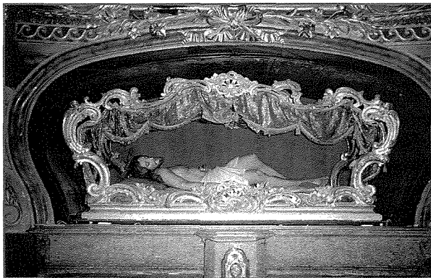
L-urna l-antika li saret bejn l-1760 u l-1767 li qiegħda ikkonservata fl-Oratorju ta' San Ġuzepp fir-Rabat

Aktar qabel kont spjegajt kif l-istatwa tal-marbut kienet giet importata minn Sqallija flimkien mal-urna ta' Kristu mejjet fejn id-dokument tal-1700, jgħidilna li din l-urna kienet riccamente elaborata , dan ifisser li din l-urna ta' Kristu mejjet kienet ta' valur artistiku kbir u ma kinetx tagħmel għajb għal dik li saret wara. Imma nixtieq nispjega li l-urna l-antika jew il-monument ta' Kristu mejjet li qiegħed ikkonservat ġewwa l-oratorju ta' San Ġuzepp mhijiex l-urna l-antika tas-seklu sittax kif ġie miktub kemm il-darba f'kotba u artikli.