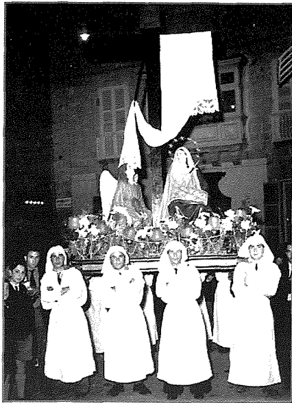
Id-Duluri fil-purċissjoni tal-1950

Għalkemm il-Ġimgħa Mqaddsa tkopri t-tmint ijiem bejn il-Hadd il-Palm u l-Għid il-Kbir, għad-devoti Maltin dan jibda jumejn qabel. Dan imħabba li fil-ġranet tal-ġimgħa tiġi organizzata l-purċissjoni tal-Madonna tad-Duluri. Din il-purċissjoni hija manifestazzjoni ta' qima u devozzjoni kbira li l-Maltin għandhom għall-Madonna. Fil-knisja Ta' Ġiezu tar-Rabat dan mhux nieqes għax f'din il-knisja nsibu waħda mill-ewwel xbihat tad-Duluri impittra fuq l-injam, id-data u ffirmata mill-artist Antonello da Messina ta' 1517. Din id-devozzjoni bdiet wara s-Sinodu ta' Kolonja fil-Ġermanja fl-1423. 112