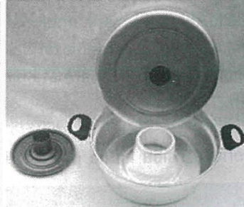
BAKE-STOVE WITH LID AND IRON GRID (Borma Forn)