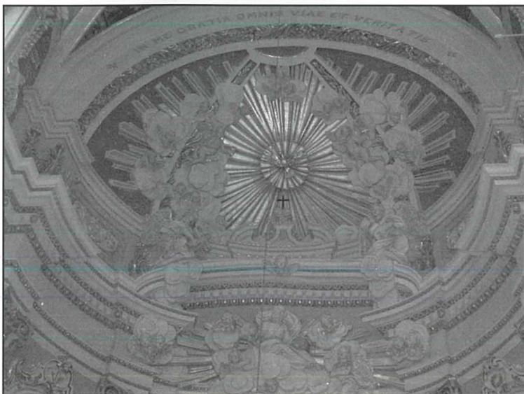
Dettall ta' l-iskultura fil-kappellun ta' l-Agunija

F'dawn iż-żewġ kappelluni, l-iskultura ma tinqafilx fl-arkata, imma tohroġ u timla l-kappellun kollu. Sahansitra l-arkitrav jintesa u l-iskultura tibqa' titla' 'l fuq sa l-arzella tas-saqaf. Din l-iskultura barokka f'it issib bhala u daqshekk imponenti fil-knejjes Maltin. Ix-xjuħ tar-rahall jirrakuntaw li l-isbah skultura kienet madwar l-artal tal-kor. Jghidu li din l-iskultura kienet timla l-kor kollu bhall-kappelluni u kienet tirrappreżenta l-ġudizzju universali. Isfel kien hemm l-erwieg qeghdin jiġu mghejuna mill-anġli. L-arzella kienet mimlija b'raġġiera kbira kif naraw fil-kappelluni u f'nofsha kien hemm l-Ispirtu s-Santu. F'it 'l isfel kien hemm Alla l-Missier u Alla l-Iben fuq is-shab u mdawrin bl-anġli. Sfortunatament dan kollu nistghu biss nimmaġinawh għax għadna ma ltaqjniex ma' ritratti jew dokumenti ohra (barra rakkonti) li juruna eżatt kif kienet. Żgur hu, li din l-iskultura tqactet fil-bidu tas-seklu għoxrin, wara moviment li laqat kważi l-knejjes barokki kollha ta' pajjiżna. F'dak iż-żmien kien hawn moviment li ried inehhi l-element barokk (ikkunsidrat goff) mill-knejjes. B'xorti tajba, ahna tlifna biss l-iskultura tal-kor. Hafna mill-knejjes, fosthom ta' Haż-Żabbar u Hal Qormi (San