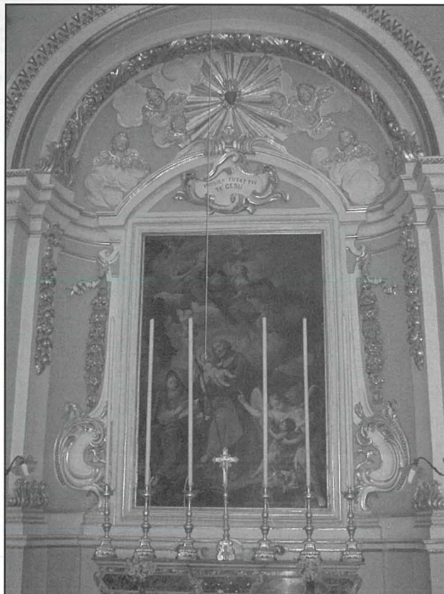
Ritratt juri eżempju ta' waħda mid-dekorazzjonijiet barokki madwar l-artali tal-ġnub. F'dan ir-ritatt qed naraw id-dekorazzjoni madwar il-kwadru tal-Patrun tagħna San Ġużepp.