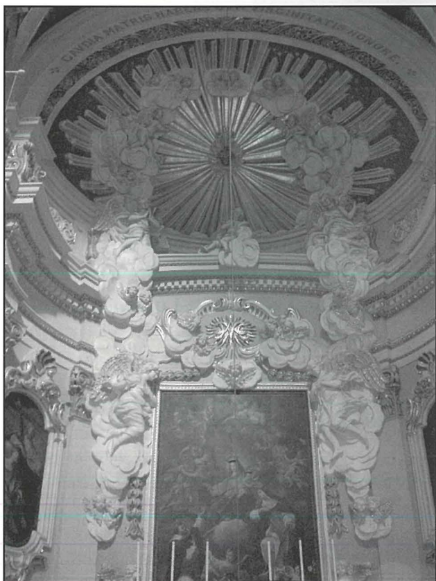
Dettall ta' l-iskultura fil-kappellun tar-Rużarju