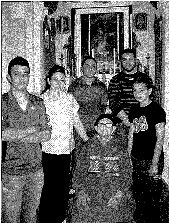
Nettu, fil-kappella San Publju