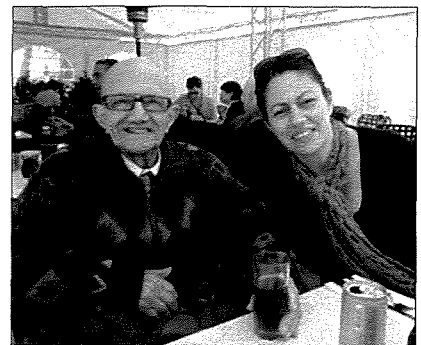
Nettu, flimkien man-neputija tiegħu Michelle meta għalaq 92 sena.

Iz-ziju kellu mhabba kbira lejn l-annimali l-iktar il-klieb. In-nies ġieli rreferew għalih bħala z-ziju, dak li kien johrog il-kelb. Meta kont zgħira kemm il-darba kont immur miegħu u l-kelba lejn in-naħa tal-Kapuċċini u kif naslu hdejn il-Kappella tal-Madonna ta' Lourdes, jagħtini l-flus biex nitfa' fil-kaxxa tal-