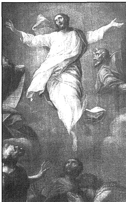
Detall mill-pittura tas-Salvatur fiż-Żejtun

Zahra kien wieħed mill-pitturi l-aktar prolifici Maltin, tant li l-kwadri tiegħu jammontaw għal mijiet u ssibhom f'ħafna knejjes tal-Gżejjer Maltin. Kien tweled fl-Isla minn familja ta' artisti li fil-parroċċa taż-Żejtun hallew aktar minn opra waħda. Hekk missieru, Pietru Pawl Zahra, kien għamel l-istatwi fil-ġebel ta' San Girgor u Santu Wistin, u żewġ angli kbar, li damu jzejnu l-kor taż-Żejtun għal madwar 200 sena, sakemm tneħħew fl-ewwel snin tas-seklu 20. Iż-żewġ qaddisin illum qegħdin fil-parti l-ġdida ta' ċimiterju ta' San Girgor. Hu dokumentat ukoll illi fiż-Żejtun għadu jeżisti l-ewwel kwadru li nafu bih ta' Francesco Zahra - is-sotto-kwadru ta' l-Assunta fl-altar titolari ta' Santa Katarina. Dan il-kwadru ċkejken Zahra pittru meta bilkemm kellu 20 sena! Miegħu pitter