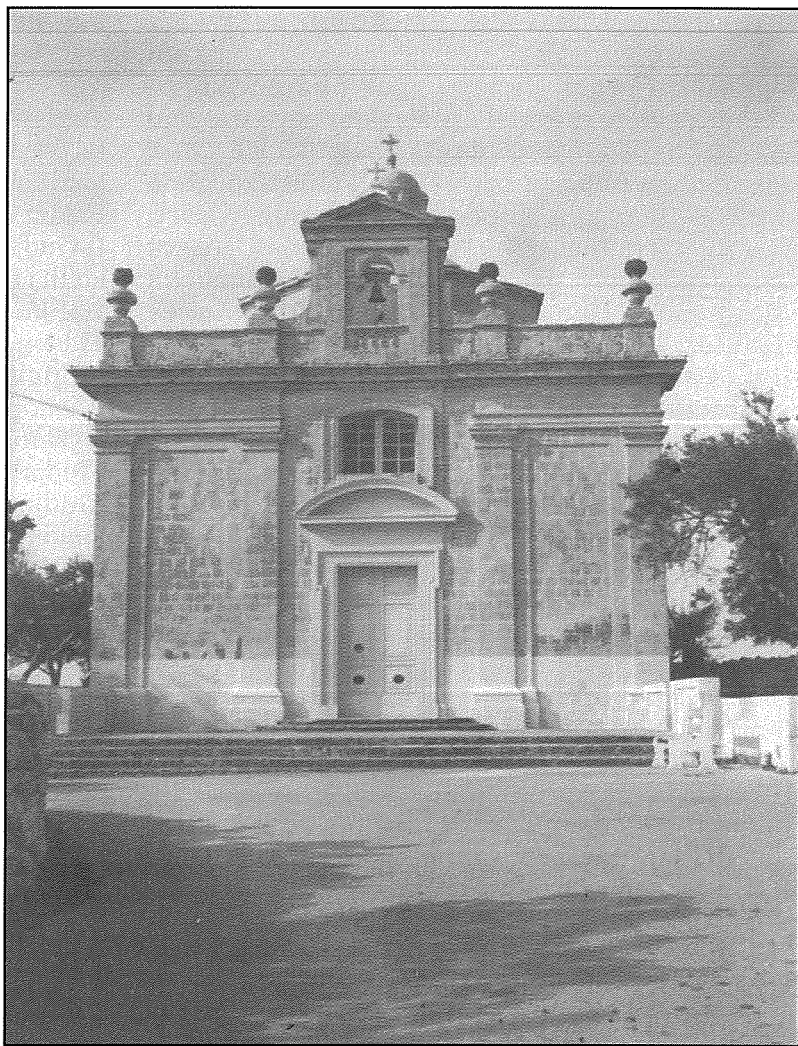
Il-Knisja ta' Loretu