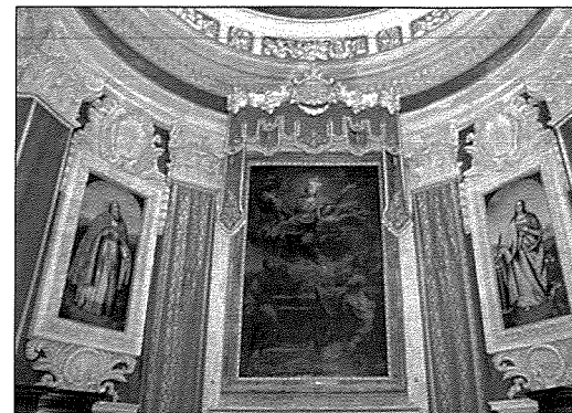
L-inkwatu Titulari u nkwati laterali tal-Katidral Għawdex.

Xogħol iehor ta' Madiona fejn is-sugġett kien San Publju, insibuh ġewwa l-Katidral ta' Għawdex. Huwa pittur lil San Publju u Sant'Agatha, Patruni ta' Malta, iż-żewġ pitturi huma laterali għall-Kwadru Titulari ta' Marija Assunta mpitter minn Michele Busuttil (1762-1831). (Mangion, 2014)