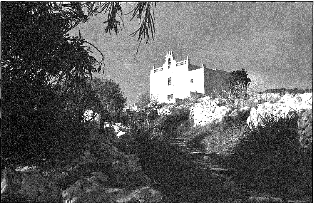
Il-Kappella tal-Lunzjata kif tidher mit-telgħa tas-Salib ta' l-Għolja.

l-ewwel kappella fuq Ta' l-Għolja imma l-orijini taghha jmorru lura għat-tieni nofs tal-hmistax-il seklu. Kien Dun Guljelm Tonna, Dekan tal-Kapitlu tal-Katidral, li bena l-kappella ta' l-Annunzjata fl-artijiet tiegħu kif ukoll xi kmamar għall-bżonnijiet tal-prokuratur. Kull sena Dun Guljelm kien johroġ minn butu l-ispejjeż kollha involuti fil-manutenzjoni taghha u fiċ-ċelebrazzjoni tal-festa. Dun Guljelm Tonna kien miet fl-1482, allura l-kappella nbriet żgur qabel din is-sena. F'xi dokumenti nsibu miktub li l-kappella reġgħet inbniet fl-1494 mill-poplu Siġġiewi bit-thabrik tal-kapillan Dun Amator Zammit. Mons. Vincenz Borg,