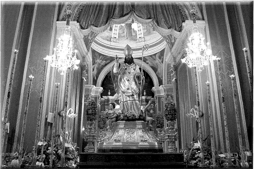
Il-vara titolari ta' San Nikola, kapolavur ta' Pietru Felici

L-Isqof Mons. Pietru Dusina kien għamel iż-żjara pastorali tiegħu fir-raħal nhar it-2 ta' Frar 1575. Dakinhar huwa kien kiteb fir-rapport tiegħu li d-devozzjoni lejn San Nikola kienet waħda kbira, il-knisja parrokkjali kienet sabiħa u waqqaf ukoll fiha l-Fratellanza tas-Ssmu Sagrament.