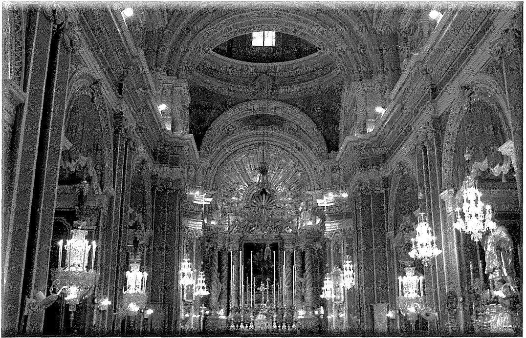
Il-knisja parrokkjali minn ġewwa, armata għall-festa kif narawha illum