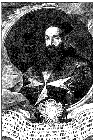
L-Isqof Tommaso Gargallo

jissemmew fil-kitba tal-Isqof Gargallo għadhom weqfin sal-lum, oħrajn spiċċaw biex intilfu għalkollox.