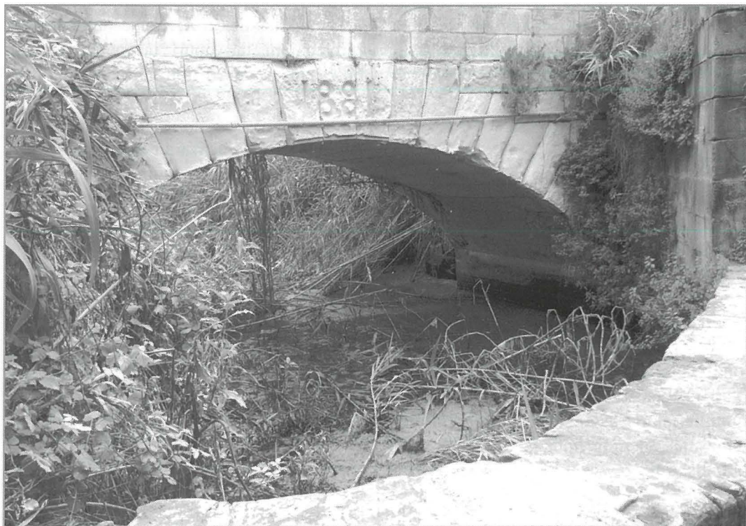
It-Troll tal-Wied tal-Girgenti (1881)