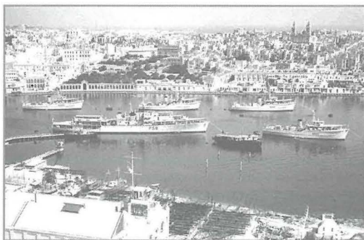
Vapuri tal-flotta Inġliża fil-Port il-Kbir għall-bidu tas-seklu XX

Il-Kanal tas-Swez u l-Vapuri tal-Faħam (Steamships). Fl-istess waqt, dan huwa kollu xhieda tal-iżvilupp li ġara f'Malta, bħal f'pajjiżi oħra Ewropej, fit-tieni nofs tas-Seklu XIX, speċjalment wara l-invenzjoni tal-vapuri tal-metall jaħdmu bil-faħam u wara l-ftuħ tal-kanal tas-Swez fl-1869. B'hekk il-vjaġġ lejn il-Lvant Imbiegħed qsar u ħfief bil-bosta waqt li żdied il-kummerċ. Wara t-tmim tal-gwerra tal-Krimea fl-1856, l-ammiraljat Inġliż beda żvilupp bla waqfien tal-faċilitajiet tat-tarzna u l-Port il-Kbir għall-vapuri Inġliżi – kemm kummerċjali kif ukoll navali 8 .