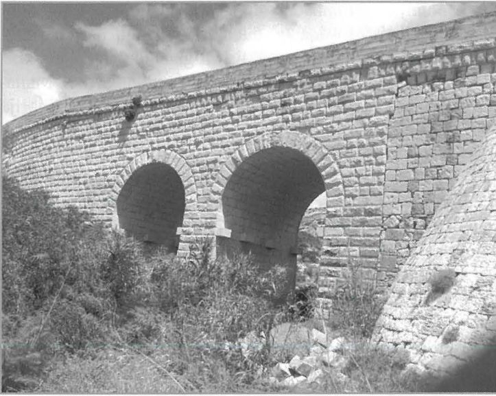
Il-Pont tat-triq t'Għar Lapsi

Minħabba dawn il-fatturi - nuqqas ta' xogħol, emigrazzjoni, mard u epidemiji, kif ukoll il-livell baxx t'edukazzjoni fost