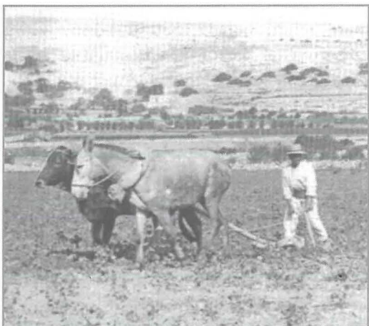
Bidwi jaħrat biż-żewġ – bil-baġħal u l-gendus (1890-1900)