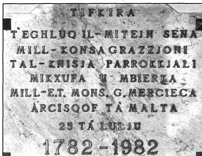
Sagristija tal-knisja, rġama b'kitba li tfakkar għelug il-mitejn sena mill-Konsagrazzjoni ta' l-istess knisja.

Hekk intemmet din il-funzjoni twila li kienet tiehu hin twil. Illum dan ir-rit ġie mqassar hafna, iżda b'dankollu għadu rit sabih, solenni u importanti fil-liturgija tal-knisja.