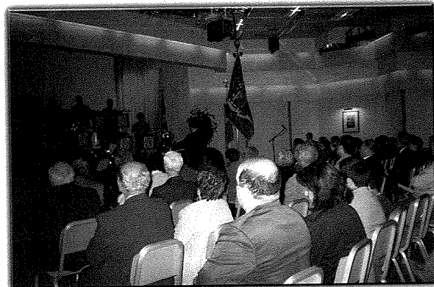
L-udjenja prezenti waqt it-tieni parti tal-kuncert li s-Sagra Familja Brass Band tellgħet għewwa s-Sol Suncrest, il-Qawra.

Sabiex dawn il-programmi jirnexxu hemm bżonn ukoll hafna finanzi u fondi. Dawn jiġu permezz ta' sponsors li minn hawn niringrazzjawhom, u wkoll