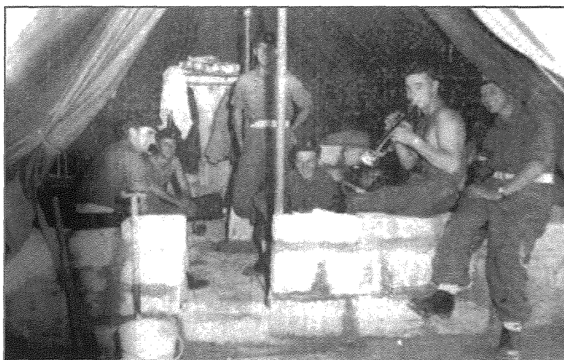
Suldati Ingliżi f'wiehed mill-kampijiet