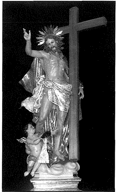
L-istatwa titulari ta' Ġesù Salvatur li hija meqjuma b'tant għożża fil-parroċċa ta' l-Ghasri. Differenza ta' kif aħna mdrorrijn biha t-Trasfigurazzjoni.