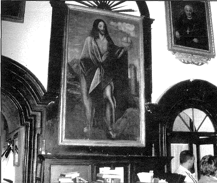
Il-kwadru titulari li kien jinsab fil-kappella ta' Wied il-Mielan, illum jinsab f'post prominenti fis-sagristija tal-knisja ta' l-Għarb. Dan il-kwadru hu imprenzabbli u uniku għax imnaqqax fuq l-injam.

Il-poplu ta' l-Għasri għoġbitu ferm l-istatwa tas-Salvatur, għalhekk għall-festa li kien imiss xtaq li jinkludi wkoll banda. L-Għasrin jagħmlu minn kollox biex il-festa tal-parroċċa tagħhom issir kif inhu xieraq, Kristu Ewkaristiku Salvatur, bir-ruh u divinità li hadd ma hawn aqwa minnhu; hekk jirraġunaw u hekk jemmnu l-Għasrin.