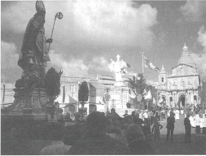
Ikompil minn paġna 41

Din l-istatwa (vara) tlestiet fis-sena 1736. Kienet skolpita mill-injam. Il-pedestall inħadem minn G.M. Vassallo. L-iskultura tal-pedestall ħadimha Ġużeppi Fabri, u kien tħallas 15-il skud. Fis-sena 1779 inħadem il-baklu tal-fidda li kien qam 160 skud, li skond ma jingħad kien ingħata lil San Nikola minn grupp ta' baħħara li kienu qegħdin jiggjieldu kontra t-Torok. 4