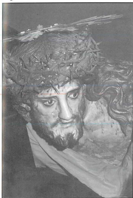
L-istatwa ta' Ġesù Redentur meqjuma fil-Bażilika Kolleġġjata ta' Marija Bambina.

Jien twelidt fl-1938 u hallejna l-Isla dakinhar ta' l-attakk fuq l-H.M.S. Illustrious fl-1941. Dan ifisser li m'ghandi ebda ideja ta' l-Isla ta' dak iż-żmien u ma niftakar xejn dwar dawk l-ewwel snin ta'