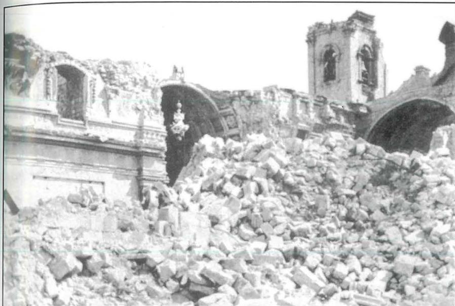
Il-Bażilika ta' Marija Bambina mgarrfa fl-attakki matul it-Tieni Gwerra Dinjija. Tidher waħda mil-linef imdendla fil-kappellun; li illum magħruf bħala l-kappellun tad-Duluri.