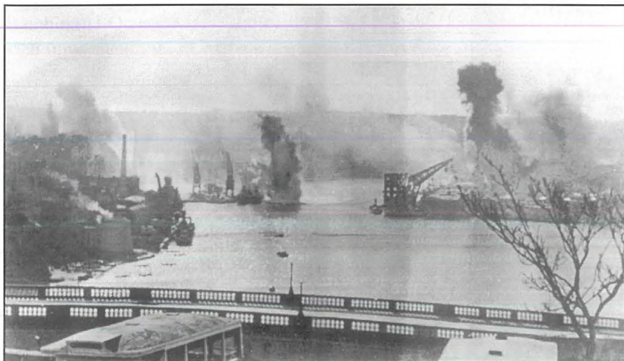
L-attakk fuq l-H.M.S. Illustrious nhar is-16 ta' Jannar 1941.