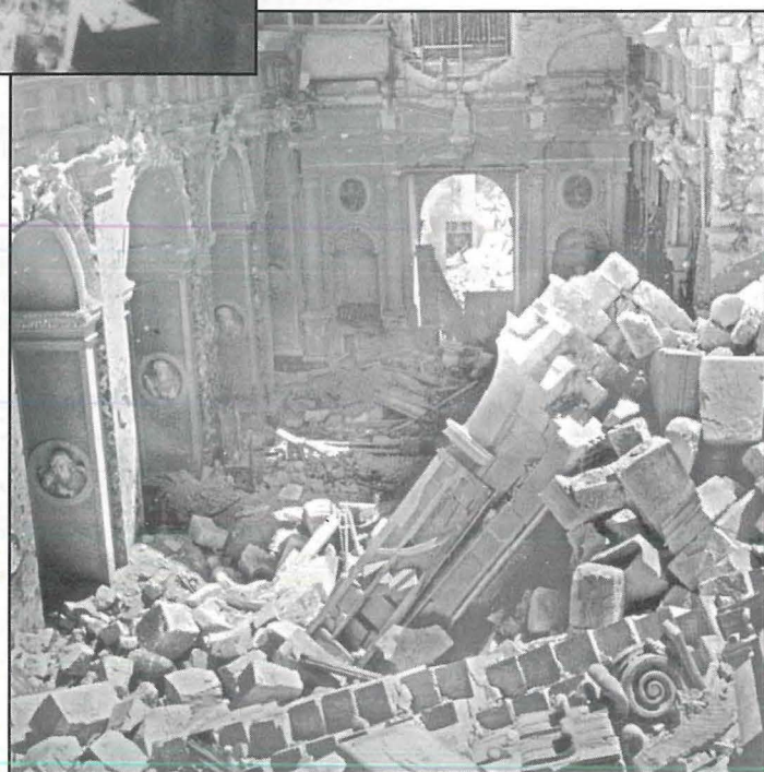
Il-Bażilika mgarrfa hlief għan-naħa tal-lemin. Jidhru wkoll l-appostli fin-navi. Dawn l-appostli għadhom jeżistu sa illum il-ġurnata.

Ridt naqsam mal-qarrejja ta' dan il-programm dawn il-ftit esperjenzi biex nuri kemm hu importanti li, ftit ftit u bil-hlewwa – u dejjem mingħajr fanatiżmu ta' ebda xorta – nagħtu sens u spjegazzjoni lil uliedna għaliex teżisti din il-gibda u mhabba kbira tagħna lejn l-Isla; li kif kien jiehu gost jispjegali missieri kull meta nghaddu minn taħt il-Mina, tassew jisthoqqilha t-titlu ta' Città Invicta (Belt Qatt Mirbuha).