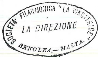
Timbru antik uffiċjali tal-Banda 'La Vincitrice'