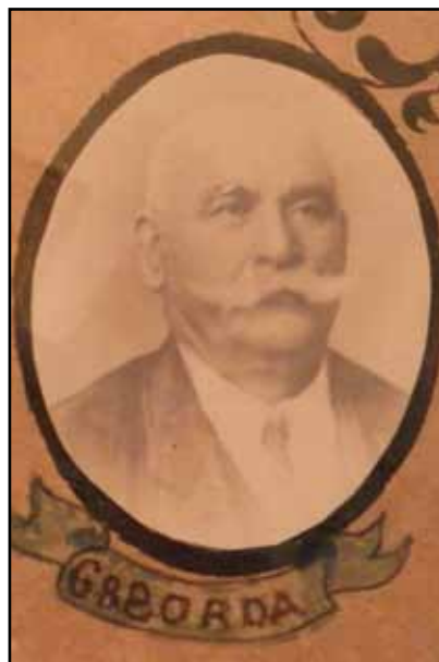
Ritratt tal-benestant Kalkariż Gan Patist Borda. Dan ir-ritratt jinsab gewwa s-sede tas-Soċjetà fl-inkwatra tal-fundaturi.