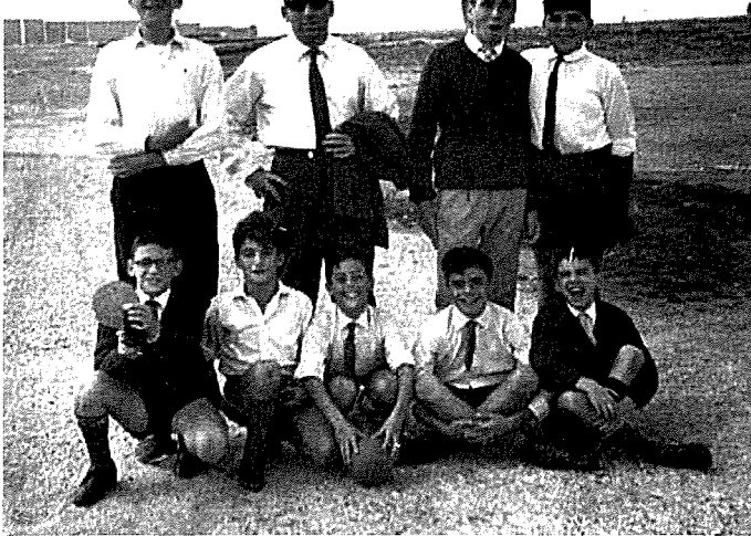
1965: Il-Praesidium Madonna tal-Midalja Mirakoluża waqt mawra għand il-Gizwiti fin-Naxxar.