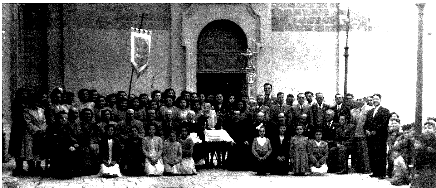
18 ta' Diċembru 1949: Il-legjunarji tal-Isla kkonsagraw lilhom infushom lill-Qalb ta' Ġesù u ta' Marija waqt funzjoni reliġjuża li saret fil-knisja tal-Porto Salvo meta l-parroċċa kienet għadha qed tinbena mill-ġdid.