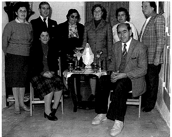
18 ta' Diċembru 1985: Il-membri attivi kbar tal-Isla.

Issa billi fil-Kottonera kien hemm bosta loġoġ tal-mazunerija forsi xi wħud setgħu b'xi mod jassoċjaw din l-għaqda ma' dawn il-loġoġ, forsi taħt forma oħra. L-irġiel bdew iżuru l-morda u l-anzjani fl-isptar San Vincenz. Hawn iltaqgħu ma' każ ta' anzjan li kien ilu 19-il sena ma jżuruh uliedu. Bil-kuntatti tal-membri l-anzjan, kellu x-xorti jara l-uliedu fl-aħħar xahar ta' hajtu. Kienu jżuru l-hwienet tax-xorb u jagħmlu kuntatti fil-każini u fil-pjazez, jiehdu l-Madonna fil-familji u jhajru għall-Konsagrazzjoni lill-Qalb ta' Ġesù u Marija, jiehdu nies fis-siġġu tar-roti l-quddies u jżuru l-morda fi djarhom.