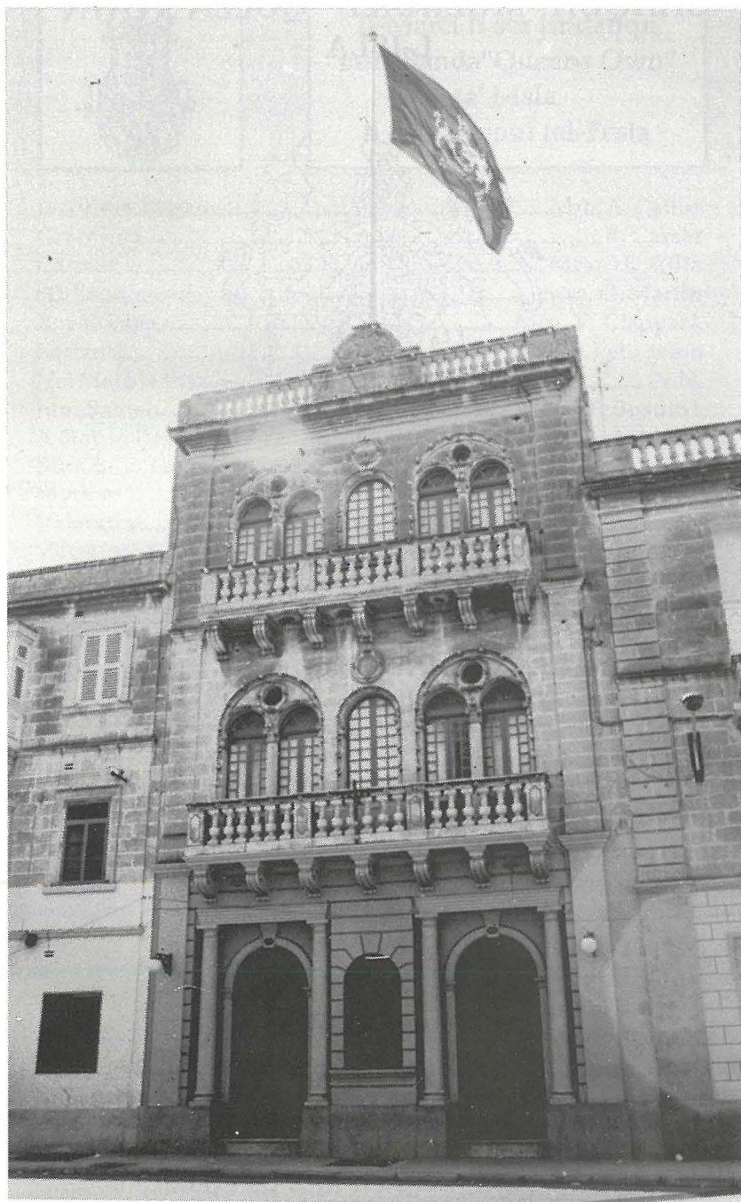
Il-faccata tal-każin kif reġghet inbniet wara t-tigri tal-gwerra