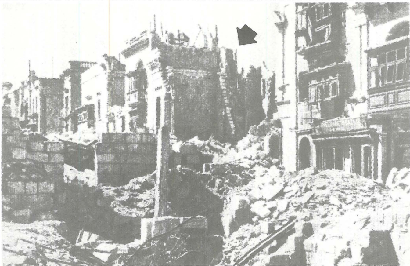
Dak li jidher immarkat bi vlegġa huma l-fdalijiet tal-każin wara wiehed mill-attakki tal-ghadu