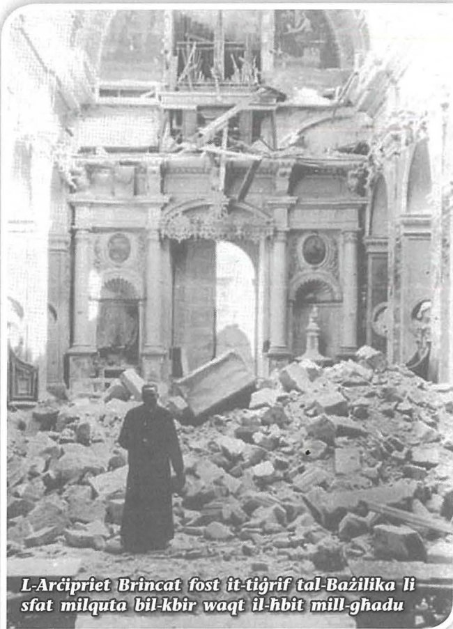
L-Arcipriet Brincat fost it-tigrif tal-Bażilika li s'fat milquta bil-kbir waqt il-ħbit mill-ghadu