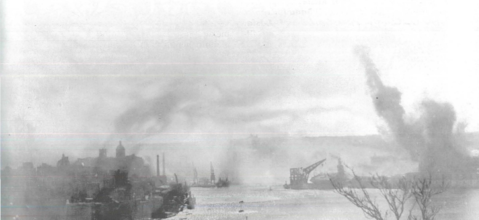
L-attakk fuq l-HMS Illustrious nhar is-16 ta' Jannar 1941