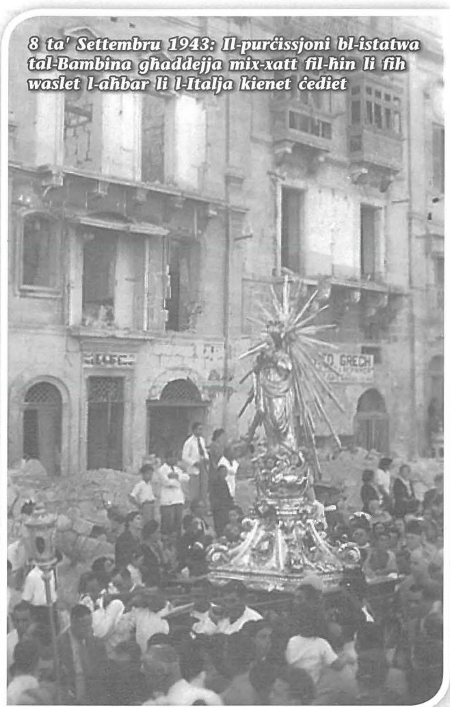
8 ta' Settembru 1943: Il-purċissjoni bl-istatwa tal-Bambina għaddeja mix-xatt fil-hin li fih waslet l-aħbar li l-Italja kienet ċediet

Din l-intervista gjet traskritta kelma b'kelma minn Joseph M. Pulis