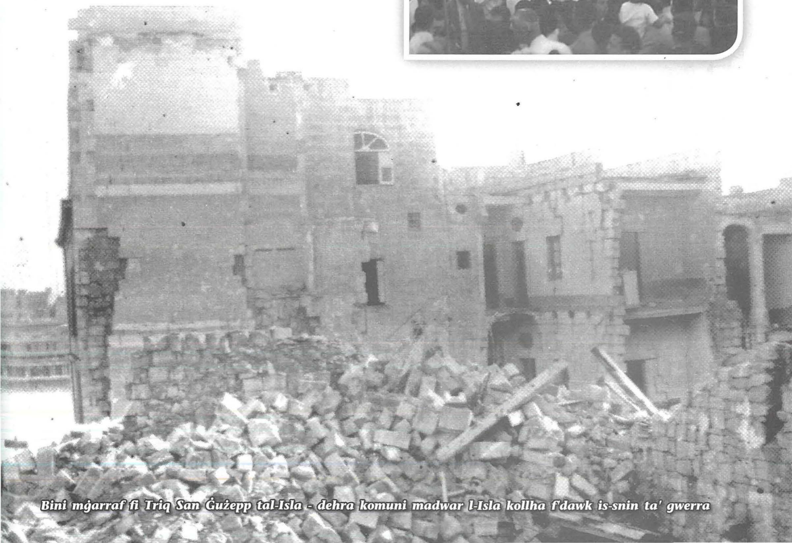
Bini mgarraf fi Triq San Ġużepp tal-Isla - dehra komuni madwar l-Isla kollha f'dawk is-snin ta' gwerra