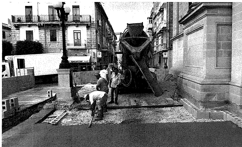
Xogħol ta' restawr fuq z-zuntier tal-Knisja

Is-sena li ġejja ser tkun waħda impenjattiva ferm għall-membri tal-KPP. Dan minħabba li hemm diversi proġetti li jridu jinbdeu. Bla dubju il-priorità għall-parroċċa issa għandha tkun it-twaqqif tal-Kummissjoni Djakonija. Din ilha snin biex tibda imma issa waslet biex tithejja. Barra minn hekk irid jiġi magħżul u jibda jiltaqa' t-Tim li ser jorganizza l-festa tal-2018. Ma' dawn wiehed irid isemmi l-bidu tax-xogħol fuq sit ġdida tal-Internet għall-parroċċa, u t-tkomplija ta' proġetti ta' restawr, tax-xogħol fuq iz-zuntier tal-knisja u tal-istudju fuq l-istatwa tar-Redentur.