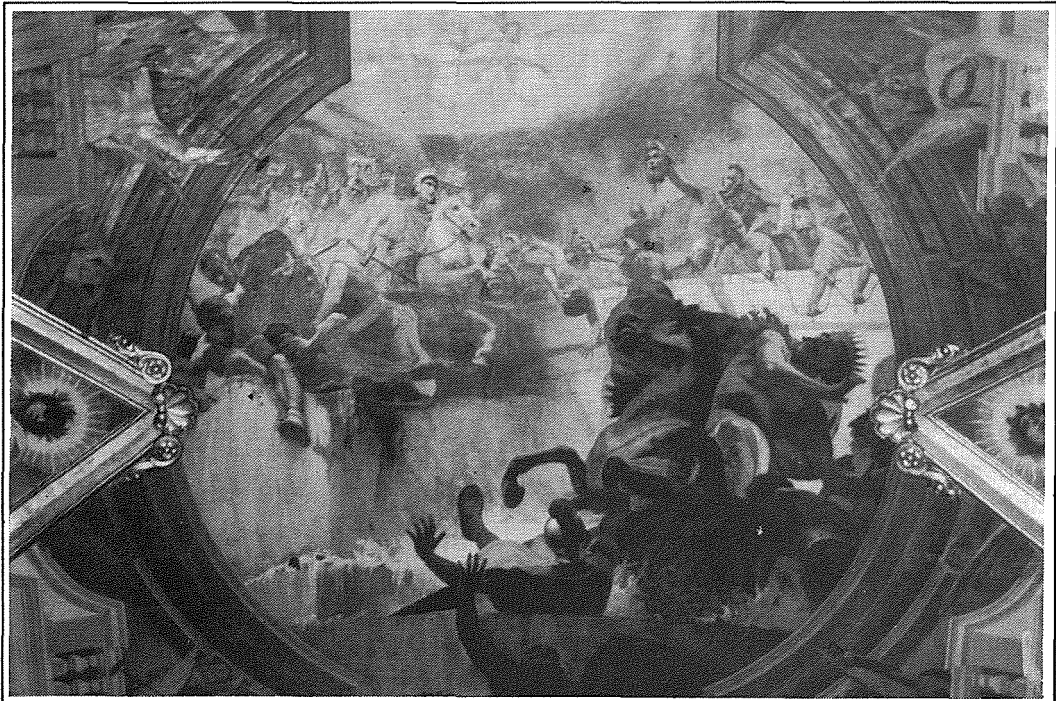
Siltiet mill-pittura tal-Bażilika – San Kostantinu u d-dehra tas-Salib.

Fi żmienha kienu qed isiru bosta tibdiliet fl-Imperu Ruman li kien jaħkem id-dinja. Kienu s-snin twal ta' persekuzzjoni kontra r-Reliġjon tan-Nazzarenu, li matulhom mietu bosta persuni ta' kull sess u ta' kull età, ta' kull kultura u ta' kull pajjiż. Bosta u bosta sofrew il-martirju, billi b'demmhom issiġillaw twemminhom. Kien hemm ukoll l-ereżiji, li ħabbtu l-Knisja ta' Kristu u ġibdu warajhom bosta segwaċi. Fis-sena 284, laħaq imperatur Dijokleżjanu li deherlu li kellu jġib bidla