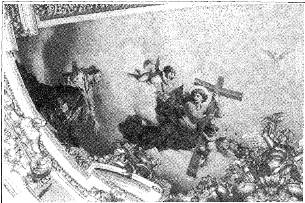
Il-Glorja ta' Santa Liena – pittura fil-knisja.

Fawsta bit-tama li din it-tieni mara tiegħu tlahhaq lil binha suċċessur ta' Kostantinu. Fawsta wkoll messitha l-istess xorti meta saret magħrufa l-verità. Meta tqis dan kollu, jidher kemm huma flokhom kliem S. Girgor il-Kbir li Elena kebbset il-qlub ta' Ruma bid-dawl tal-Fidi.