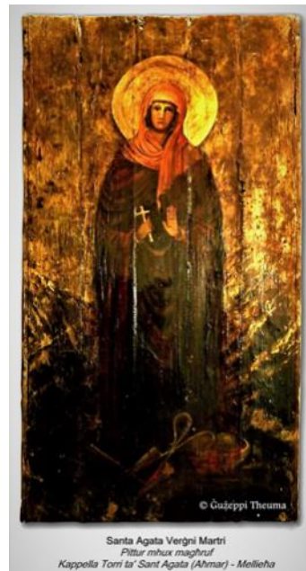
Santa Agata Verġni Martri Pittur mhux magħruf Kappella Torri ta' Sant'Agata (Ahmar) - Mellieħa