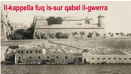
Il-kappella fuq is-sur qabel il-gwerra

Kappella unika f'Malta li nbriet sabiex taqdi l-bżonnijiet ta' sezzjoni partikolari Maltija hija dik ta' Santu Rokku li tinsab fuq is-sur ( counterguard ) ta' San