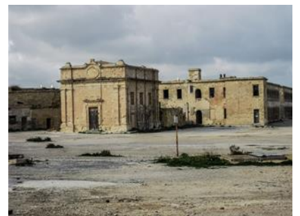
L-istat ta' telqa u abbandun li fih tinsab bħalissa l-kappella u l fortizza