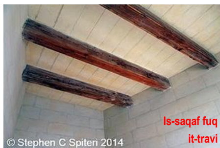
Is-saqaf fuq it-travi

Il-binja nnifisha kienet tikkonsisti minn kamra waħda f'forma ta' trapizium bil-faċċata wiegħsa aktar milli kienet in-naħa ta' wara. Ma kellha l-ebda tiżjin u kienet imsaqqfa bix-xorok imqiegħdin jistrieħu