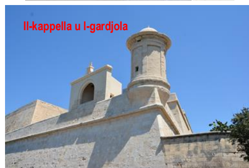
Il-kappella u l-gardjola

Permezz ta' flus mill-UE beda xogħol estensiv f'dak li hu tiswija ta' swar tal-fortifikazzjonijiet tal-belt Valletta, inkluż ir-rikostruzzjoni ta' din il-kappella. Ir-rikostruzzjoni saret fuq id-dokumentazzjoni misjuba fl-arkivji Maltin kif ukoll fuq ritratti u l-fdalijiet li kien għad baqa'. Nistgħu ngħidu li llum ir-rikostruzzjoni tal-binja l-ġdida hija kopja fidila ta' dik li kien bena l-Gran Mastru Lascaris fl-1643.