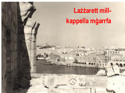
Lażżarett mill-kappella mġarrfa

fettiv. Fl-1809 kienet saret pittura titolari għall-kappella mill-pittur Malti Gaetano Calleja. Kienet titmexxa mill-patrijiet Kapuċċini tal-Furjana u kienet tintuża biss meta kienet issirilhom talba mill-gvern kolonjali ta' dak iż-żmien. Il-kappella kienet baqgħet tintuża sal-1930. Sfortunatament il-kappella saritilha ħafna ħsara matul it-Tieni Gwerra Dinjija,