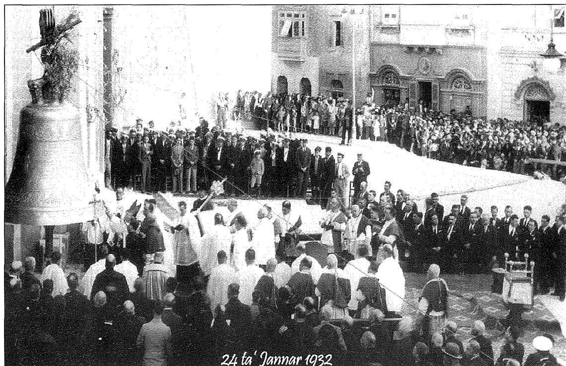
24 ta' Jannar 1932