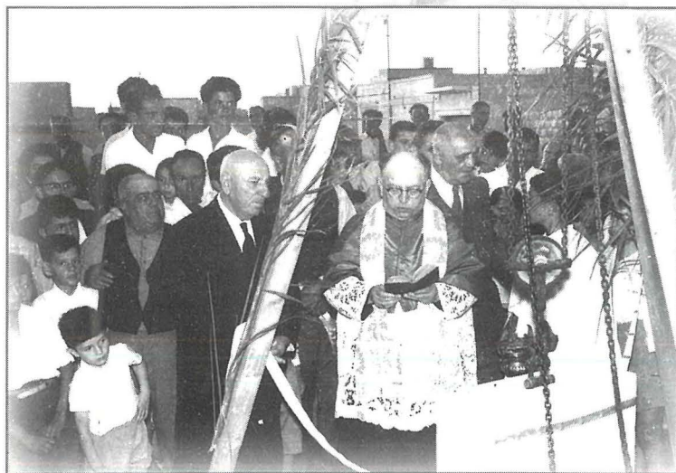
L-ewwel ġebba tal-post il-ġdid tal-M.U.S.E.U.M. fi Triq Papa Ġwanni XXIII

parrokkjali ta' l-Imġarr hu wiehed mix-xogħolijiet tiegħu l-aktar importanti.