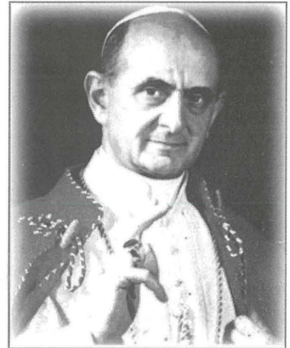
Papa Pawlu VI

Tajjeb ukoll li nikkwota x'qal il-Papa Pawlu VI nhar Santa Marija ta' l-1964, "Illum qegħdin niċċelebraw festa kbira ta' ferħ għalina: dik ta' Santa Marija. Hija turina kif għandna ngħixu biex nilhqu l-quċcata ta' glorja li laħqet Hi. Il-Madonna mis-Sema tifrex dirghajha biex tghinna u tagħmilna kuraġġ. Għalhekk mal-ferħ (religjosità popolari) inhossu wkoll tama kbira, it-tama li ngħixu sewwa f'din il-hajja biex niksbu l-hajja ta' dejjem."