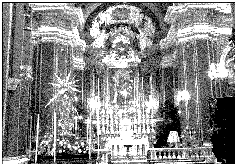
Il-Bambina armata fil-knisja fl-1981. 400 sena parroċċa.