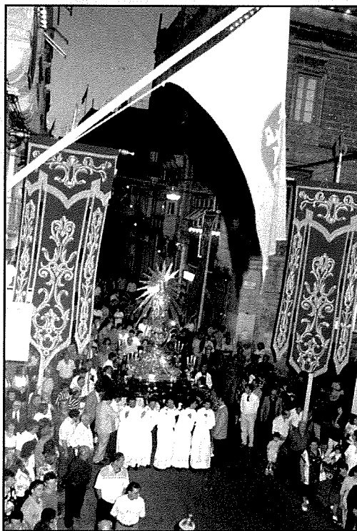
Il-pellegrinaġġ li sar minn San Filippu bl-istatwa ta' Marija Bambina, fi Triq il-Vitorja nhar il-31 ta' Mejju, 1996.

herba ta' din il-belt li ma ntrebhiex, baqgħet shiħa bla ma għalha xejn. Minhabba l-qerda tal-knisja ta' din il-belt, hi laqgħet fiha r-Reverendissmu Kapitlu tal-Bażilika Sagrosanta u għamlitha ta' Parroċċa u Kolleġġjata. Kien ta' hena li fiha stikennet ukoll l-istatwa meqjuma ta' Marija Bambina, Omm Alla. Dan gara mis-sena 1943 sas-sena 1957.