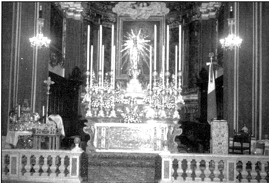
Il-Bambina armata fuq l-altar maġġur – Mejju 1996. 75 anniversarju ta' l-Inkurunazzjoni.

aktar bombi milli waqghu f'Londra. Ghalhekk ma setax jonqos li l-Bażilika s'fat imġarrfa. Minhabba f'hekk l-Isla spiċċat minghajr knisja parrokkjali. B'xorti tajba l-knisja ta' San Filippu ma waqghetx u ghalhekk hadet f'idejha t-tmexxija tal-parroċċa, sakemm issir ir-rikostruzzjoni tal-Bażilika l-ġdida. U minn hemm kienu qed jiġu amministrati s-Sagramenti kollha u jiġu ċelebrati l-festi kollha inklużi l-Ġimgha l-Kbira u l-Bambina. Il-laqgħat tal-Kapitlu wkoll kienu qed isiru fil-kunvent li hemm immiss mal-knisja.