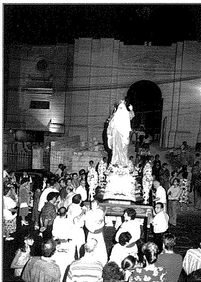
L-Istatwa Titulari quddiem il-Knisja Parrokkjali, waqt li bdiet tinbena

L-Istatwa Titulari quddiem il-Knisja waqt id-dħul tal-Purċissjoni, fil-Knisja Matriċi