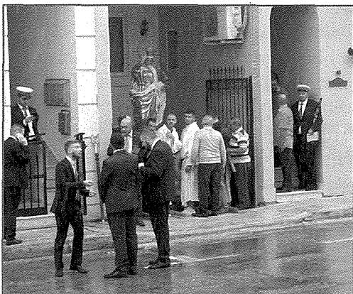
Mumenti mill-Purċissjoni fl-għeluq il-Mitt Sena Parroċċa, l-istatwa tistkenn fi 'drive-in' habba t-temp hazin waqt il-Purċissjoni