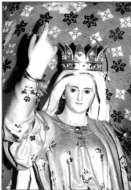
L-Istatwa Titolari ta' Santa Venera qabel l-ewwel restawr