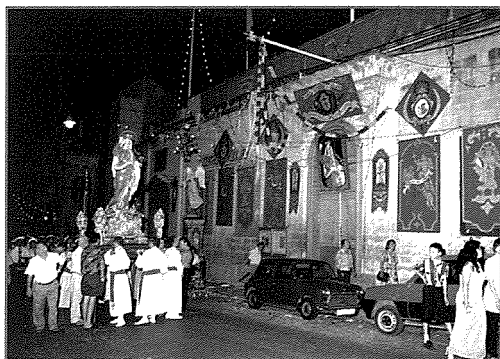
L-Istatwa Titulari quddiem il-maħżen tal-armar