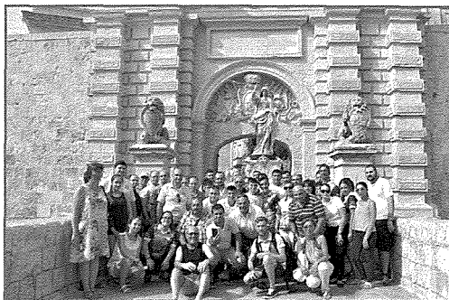
Mument storiku tal-istatwa Titulari quddiem il-Bieb tal-Imdina

Fil-2018 waqt il-purċissjoni ta' nhar il-festa, il-Vara ddaħhlet fil-Knisja l-Qadima wara 13-il sena li kien ilha li harget minn din il-knisja.