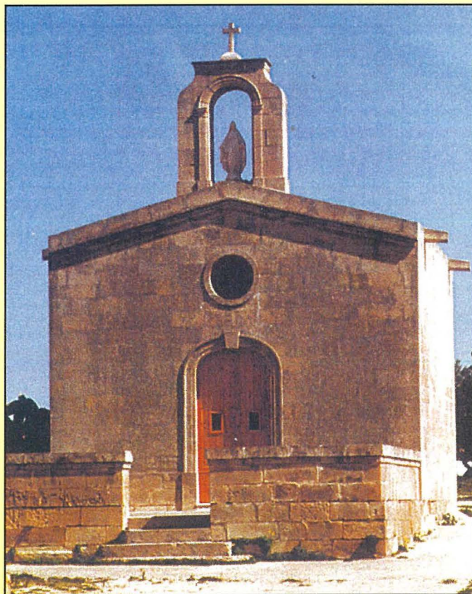
Il-Kappella tal-Kuncizzjoni li reġġet inbniet wara t-tieni gwerra dinija u li tinsab viċin ta' fejn kien hemm il-mitjar f'Ta' Qali.